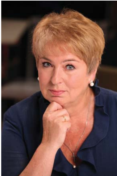
ЛІБАНОВА Елла Марленівна — академік НАН України, академік-секретар Відділення економіки НАН України, директор Інституту демографії та соціальних досліджень ім. М.В. Птухи НАН України