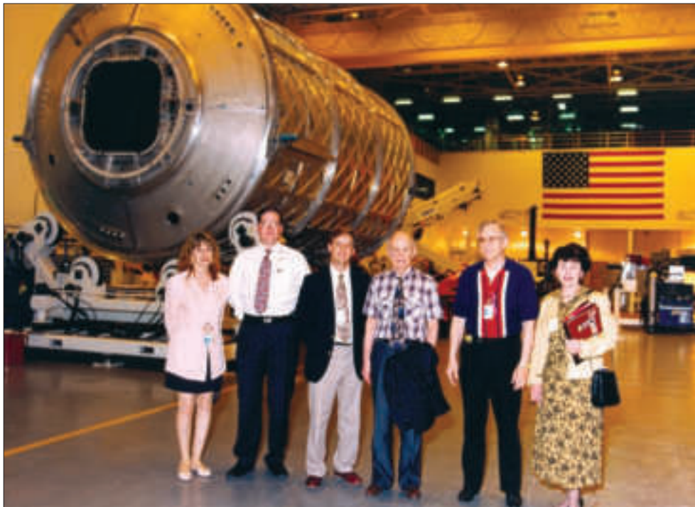
У дослідницькому центрі НАСА. США, 1996 р.

диціях, польових дослідженнях, користуються науковими бібліотеками і науковим обладнанням. Щороку проводяться Всеукраїнський конкурс-захист науково-дослідних учнівських робіт, всеукраїнські і міжнародні літні школи, олімпіади з основних напрямів природничих, технічних і соціогуманітарних наук. Академічні вчені і вишівські педагоги виступають тут лекторами, наставниками, експертами, консультантами.