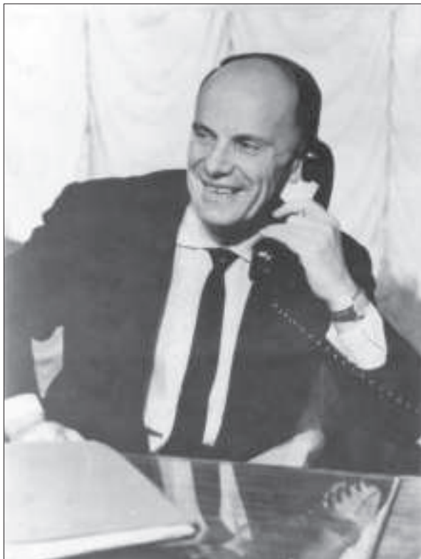
Борис Євгенович Патон. Київ, 1965 р.

практикою. Віддаючи належне класичним, основоположним наукам (серед точних наук — це математика; у природознавстві — фізика, хімія і біологія; у соціогуманітаристиці — історія, філософія і філологія), в Академії в пріоритетному порядку розвивалися їх найновіші відгалуження і науки, що виникали на перетині існуючих, загалом ті науки, які давали якісно нове знання і нові продуктивні технології. Перед інститутами ставилися завдання посісти лідерські позиції, стати головними науковими установами галузі в Україні та світі.