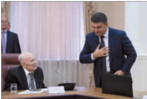
З Прем'єр-міністром України В.Б. Гройсманом. Київ, 2016 р.

Борис Євгенович наголошує на необхідності створювати науковій молоді умови для професійної реалізації в Україні. І тут недостатньо зусиль тільки наукових інституцій. Потрібні «заходи на державному рівні. Слід передбачати в Державному бюджеті України кошти для підтримки молодих учених і підвищувати розмір фінансування тих форм підтримки, які тривалий час не переглядалися. Необхідно також розробити і запровадити державну програму пріоритетного пільгового молодіжного кредитування на будівництво або реконструкцію і придбання житла, першочергового надан-