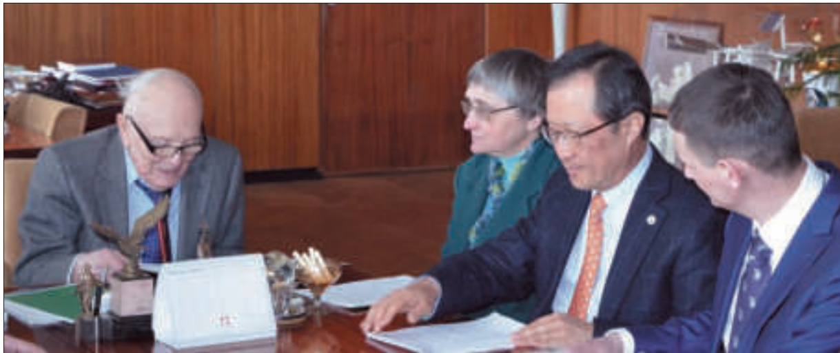
Зустріч з головою Ради директорів компанії Elsevier Йонг Сук Чі (другий праворуч). Київ, 2016 р.

інформаційно-аналітичне забезпечення діяльності Адміністрації Президента України, центральних органів виконавчої влади.