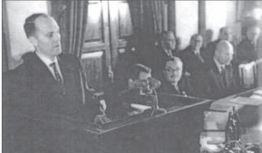
Програмна промова Б.Є. Патона на виборах президента АН УРСР. Лютий 1962 р.

завжди була її найсильнішою стороною. «Я переконаний, — говорив Борис Євгенович, — що потрібно і далі домагатися випереджального розвитку фундаментальних досліджень, бо тільки маючи надійні результати у сфері фундаментальної науки, можна справді перейти до серйозних, результативних, плідних прикладних досліджень і потім до дослідно-конструкторських розробок, до створення тих технологій, які можуть і повинні внести революційні зміни (саме революційні!) в різні галузі народного господарства» 2 .