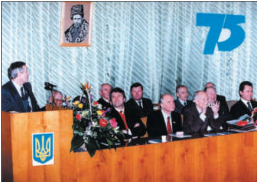
На святкуванні 75-річчя Інституту літератури ім. Т.Г. Шевченка НАН України. Київ, 2001 р.

загальноакадемічний фундаментальний проєкт «Історія української літератури» у 12 томах, у якому літературний процес в Україні розглядатиметься від найдавніших часів до сьогодення.