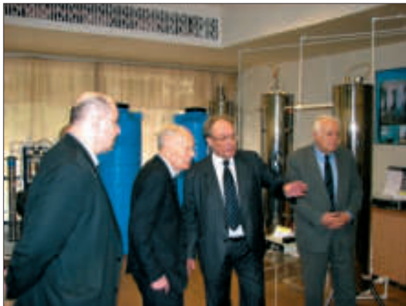
В Інституті колоїдної хімії та хімії води ім. А.В. Думанського НАН України. Київ, 2008 р.