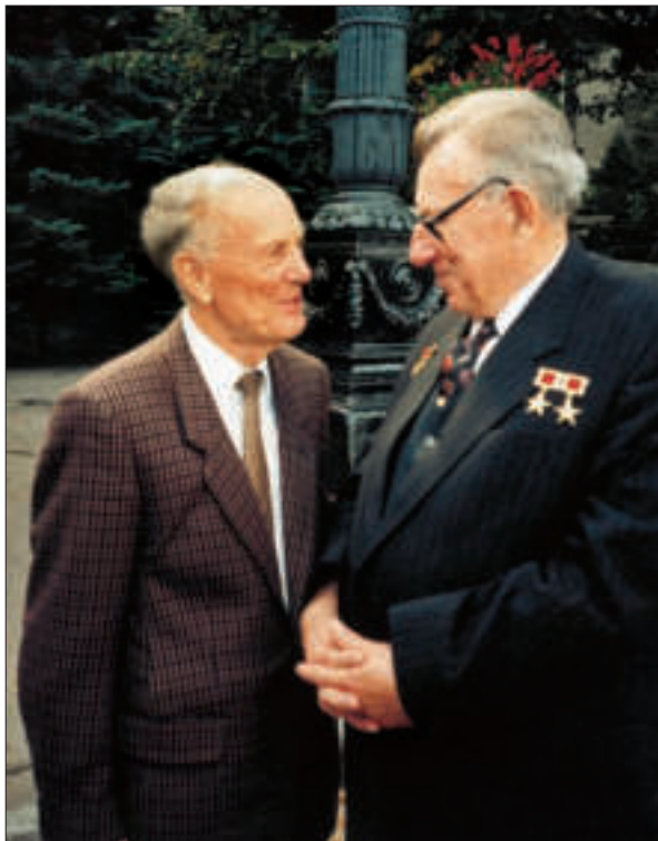
Б.Є. Патон з Генеральним конструктором КБ «Південне» В.Ф. Уткіним. Дніпро, 1996 р.

Враховуючи складну демографічну ситуацію в Україні, Б.Є. Патон у 2002 р. підтримав ініціативу щодо відновлення в Академії Інституту демографії в розширеному варіанті порівняно з тим, яким він був у 1918–1938 рр. Інститут демографії і соціальних досліджень (від 2009 р. — ім. М.В. Птухи) зарекомендував себе як установа, що серйозно займається аналітичними матеріалами з питань людського розвитку, соціально-демографічних процесів в Україні, підготовки соціально-демографічних моделей і прогнозів.