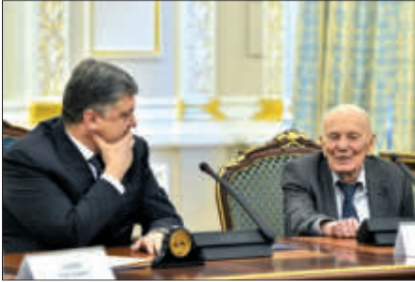
З Президентом України П.О. Порошенком. Київ, 2017 р.

до тих громадських діячів, які послідовно виступали за мирне розв'язання міжнародних конфліктів, співіснування держав з різними соціальними системами, виключення загрози застосування атомної зброї. Головний урок, який він вивів з усього наповненого великими трагедіями ХХ ст. і який пропонує взяти за принцип життя, говорить: «Цивілізація повинна викоренити будь-які екстремальні методи врегулювання як міжнародних, так і внутрішніх конфліктів» 53 .