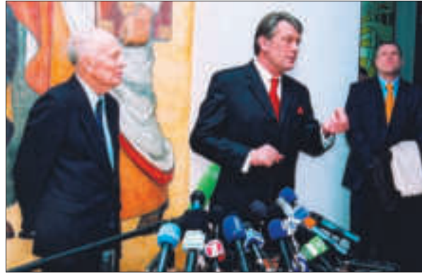
На зустрічі Президента України В.А. Ющенка з науковцями. Харків, 2006 р.

Сьогодні ознакою інноваційного мислення вважається уявлення суспільства майбутнього у вигляді суспільства знання, суспільства, в якому економіка побудована на знаннях, у якому виробництво наукового знання стає основним видом діяльності. Борис Євгенович ще в публікаціях тридцятирічної давності окреслив основні ознаки цього суспільства та рушійні сили його формування. Доречним тут буде згадати його статтю в журналі «Общественные науки» за 1982 р. «Широке використання наукових досягнень, — писав він, — є нині головною умовою підвищення продуктивності праці, інтенсифікації суспільного виробництва, суттєвих перетворень у структурі народного господарства та сфері духовного життя людей» 52 . Лейтмотив статті в тому, що процес перетворення науки на безпосередньо продуктивну силу є визначальним для виникнення якісно нового суспільства.