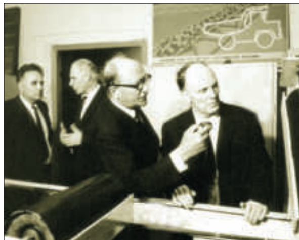
Б.Є. Патон і М.С. Поляков в Інституті геотехнічної механіки. Дніпро

лося відстояти свою позицію. Фундаментальна технічна наука в Академії пішла на піднесення завдяки як внутрішнім трансформаціям, так і переходу до неї науково-технічних установ із галузевих структур. 1960–1980-ті роки були періодом активного творення нових технічних і природничих наукових установ в Академії, яка розгорталася тематично і географічно.