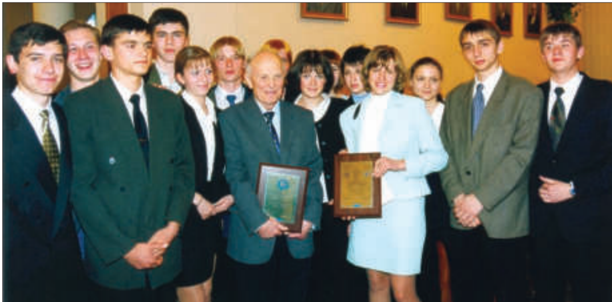
У Малій академії наук України. Київ, 2001 р.

навчальних організацій, де щорічно близько 400 студентів ВНЗ здобувають магістерський ступінь на базі Академії» 28 .