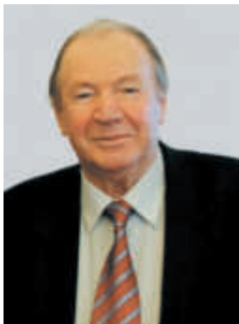
ОНИЩЕНКО Олексій Семенович — академік НАН України