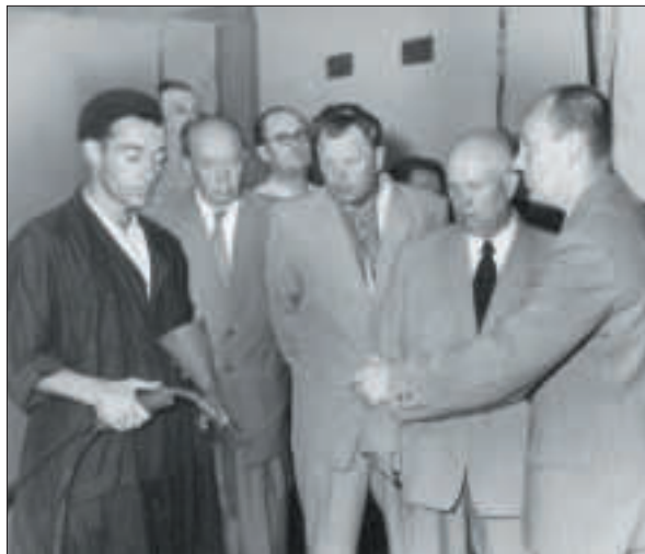
М.С. Хрущов в Інституті електрозварювання ім. Є.О. Патона АН УРСР. Київ, 1956 р.

Говорячи про роль особистості в історії, німецький філософ Артур Шопенгауер писав: «Талант досягає мети, яку ніхто не може досягнути. Геній — мети, яку ніхто не може побачити». Б.Є. Патон часто ставив цілі, які раніше ніхто не ставив. Здобував результати, яких ніхто раніше не мав. Зокрема, у творенні нових технологій матеріаловиробництва і