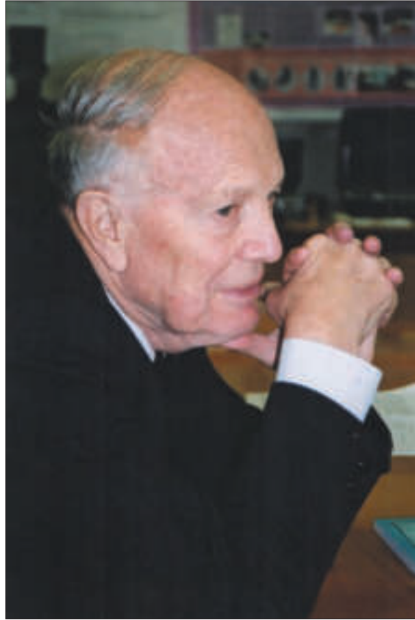
«Наука — це і є моє життя» (Борис Євгенович Патон)

Як діяч Б.Є. Патон передусім великий будівничий фундаментальної науки. Під його керівництвом Академія стала головною на-