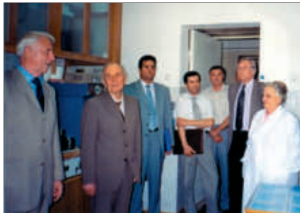
В Інституті мікробіології і вірусології ім. Д.К. Заболотного НАН України. Київ, 2004 р.