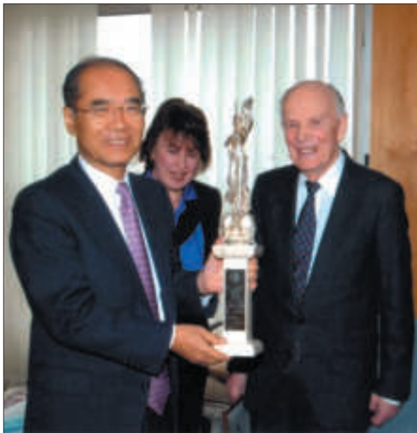
Зустріч з Генеральним директором ЮНЕСКО Коїчіро Мацура. Париж, 2004 р.

ві угоди, меморандуми про наміри, протоколи про співпрацю. На початок 2018 р. договірно-правова база міжнародної співпраці Академії становила 129 документів. Послідовно реалізується курс на системну співпрацю із зарубіжними колегами, визначений у програмній доповіді Б.Є. Патона на Загальних зборах Академії 27 лютого 1962 р., коли його було обрано президентом. Системна співпраця потребує збагачення її форм, удосконалення правової бази, розвитку особистих зв'язків учених, теоретичної новизни і практичної значущості наукових досліджень. У міжнародне академічне співтовариство можна ввійти, лише маючи фундаментальні здобутки на передньому краї науки. Головним критерієм успіху в науці «є одержання результатів світового рівня» 31 . Це незмінна формула Президента НАН України Б.Є. Патона.