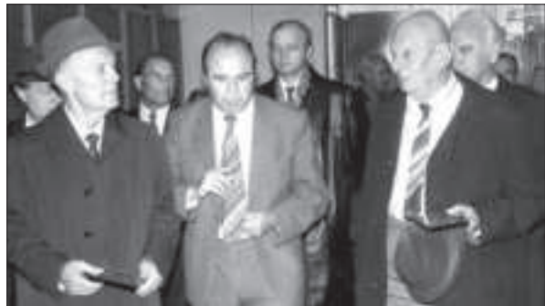
Б.Є. Патон, В.Т. Толок, А.П. Александров у Відділенні фізики плазми Харківського фізико-технічного інституту АН УРСР. Харків. 1983 р.

тур і розгортав курс на їх реалізацію. Це було помітно в галузі розвитку матеріалознавства в 60-ті роки, кібернетики в 70-ті, енергетики і біології у 80-ті. Наприкінці 80-х років Б.Є. Патон відчув потребу якісно нового етапу соціогуманітарних досліджень в Академії, які б заглиблювалися у суть суспільних процесів, моделювали подолання кризових явищ, позитивно впливали на розвиток суспільної свідомості і формування людських якостей. На засіданнях Президії частіше стали розглядати соціогуманітарні питання, фундаменталізувалася тематика і видозмінювалася структура суспільствознавчих наукових установ, шир-