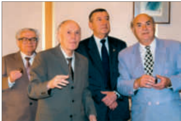
Ф.С. Бабічев, Б.Є. Патон, В.Д. Походенко і В.В. Смирнов на 60-річному ювілеї Інституту органічної хімії НАН України. Київ, 1999 р.

Президент Академії Б.Є. Патон, завжди небайдужий до мови, літератури та культури і націлений на масштабні їх досягнення, поставив завдання підготувати комплексне на-