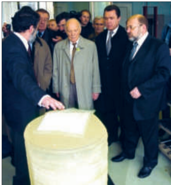
В Інституті монокристалів НАН України. Харків, 2003 р.

укове видання, яке б узагальнило історію розвитку української літератури в усій повноті і неподільності двох потоків — материкового та еміграційного 10 . Так було започатковано