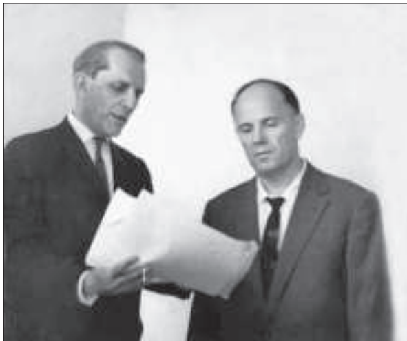
Р.С. Кавецький і Б.Є. Патон в Інституті експериментальної та клінічної онкології МОЗ УРСР (нині ІЕПОР ім. Р.С. Кавецького НАН України) під час відкриття клінічного відділу. Київ, 1966 р.