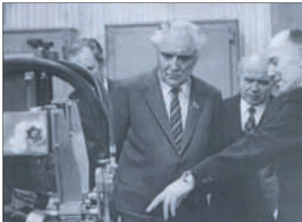
В.В. Щербицький, О.П. Ляшко, Б.Є. Патон в Інституті електрозварювання ім. Є.О. Патона АН УРСР. Київ, 1983 р.

ним державним діячем за сутністю своєї роботи. Головним у його ініціативах, що надавало їм державної ваги і соціальної значущості, було невичерпне прагнення просувати науку в першооснови відповідальних рішень у галузі технічного, технологічного процесу, виробництва, економіки, розвитку культури. Тут Борис Євгенович дотримувався і дотримується класичного благородного принципу справжніх учених, які ставлять собі за мету озброїти правителів і простих громадян науковими знаннями, адже «знання — сила», що абсолютно правильно.