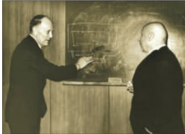
Б.Є. Патон і О.С. Давидов в Інституті теоретичної фізики АН УРСР. 1982 р.

шлях Бориса Євгеновича Патона (до сторіччя від дня народження). К., 2018. С. 13–129.