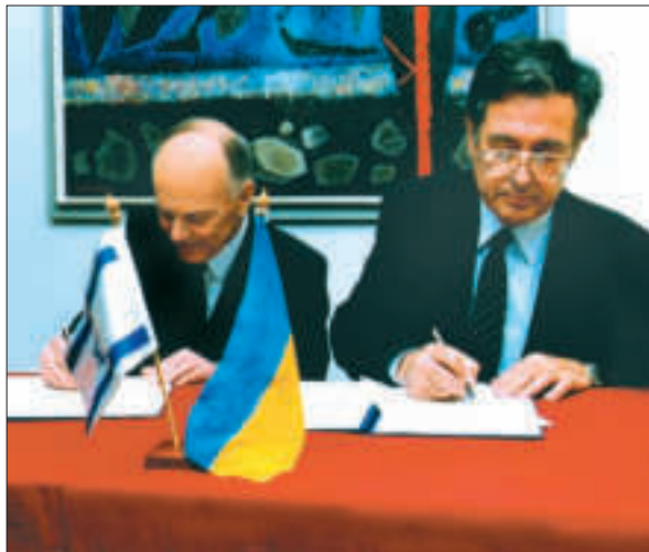
Підписання договору про співробітництво з президентом Академії наук Ізраїлю Джошуа Йортнером. Київ, 1993 р.

Головна стратегія НАН України в галузі сільського господарства, як її формулює Б.Є. Па-