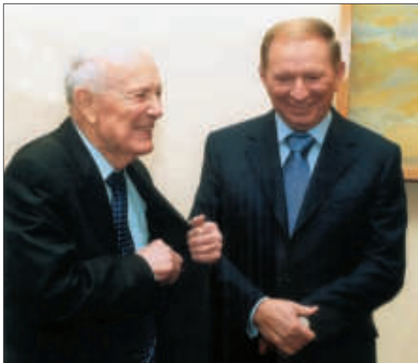
З Президентом України Л.Д. Кучмою. 2011 р.

тальних досліджень духовної культури українського народу, державно-правового будівництва, соціально-економічних проблем України з розробленням антикризових концепцій та програм, вивчення справжньої історії України, культурних, національних, мовних традицій, створення Національної програми дослідження, збереження й відродження традицій національної культури.