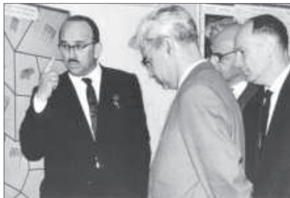
В.М. Бакуль, М.В. Келдиш і Б.Є. Патон в Інституті надтвердих матеріалів АН УРСР. 1964 р.