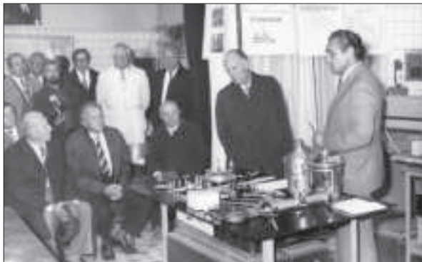
В Інституті проблем машинобудування АН УРСР. Харків, 1984 р.