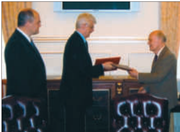
Зустріч з президентом Академії наук Австрії Гербертом Мангом. 2006 р.