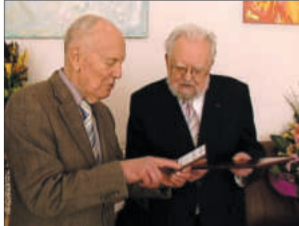
Б.Є. Патон і М.В. Попович в Інституті філософії ім. Г.С. Сковороди НАН України. Київ, 2010 р.

Ефективною формою зв'язку науки з виробництвом стали «опорні пункти», які, як і науково-технічні комплекси та інженерні центри, також зародилися в Академії з ініціативи Бориса Євгеновича. Це були виробничо-технічні підрозділи, створювані безпосередньо на підприємствах промисловості, будівництва і сільського господарства. Забезпечення кадрами, необхідним обладнанням і ресурсами здійснювалося за рахунок штатів і коштів самих підприємств. Завдання «опорних пунктів» полягає в тому, щоб готувати виробництва до використання нової техніки і технології, їх широкого застосування на базовому підприємстві і наступного поширення на інші підприємства галузі регіону.