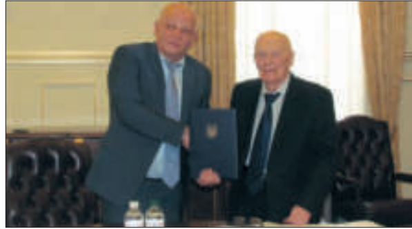
Б.Є. Патон і С.І. Кубів підписують Угоду про співпрацю між Національною академією наук України і Міністерством економічного розвитку і торгівлі України. Київ, 2017 р.

В останній чверті ХХ ст. в Академії і поза нею зросли масштаби розвитку медичних, сільськогосподарських, суспільних і гуманітарних наук. Вони консолідувалися в галузеві академічні середовища. Виникли ідеї щодо організації галузевих академії наук. Б.Є. Патон підтримав ці пропозиції, сприяв їх втіленню в життя. НАН України стала своєрідним інтелектуальним «донором» п'яти галузевих академії наук, які згодом здобули статус національних, — аграрної, педагогічної, медичної, правової, академії мистецтв. Створення галузевих академії наук збагатило структуру національної наукової системи, наблизило її до практичних потреб, поліпшило організацію і координацію фундаментальних і прикладних досліджень, загалом дало синергетичний науковий результат. Зокрема, це помітно в со-