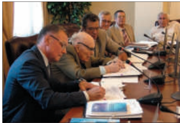
Б.Є. Патон і В.Г. Суботін під час підписання Генеральної угоди про науково-технічне співробітництво між НАН України і АТ «Турбоатом». Київ, 2018 р.