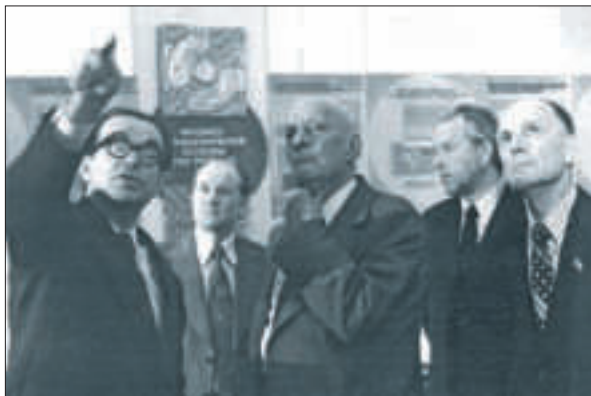
Делегація на чолі з президентом АН СРСР академіком А.П. Александровим в Інституті кібернетики АН УРСР. Зліва направо: В.М. Глушков, Л.С. Алєєв, А.П. Александров, В.С. Михалєвич, Б.Є. Патон. Київ, 1978 р.

спрямована на підтримку найважливіших для держави наукових проектів, науково-технічних розробок з високим ступенем готовності, в тому числі в інтересах національної безпеки та оборони, придбання нового та модернізацію наявного наукового обладнання, підтримку талановитих молодих дослідників, забезпечення спільних міжнародних проектів та участі в діяльності міжнародних наукових організацій 58 .