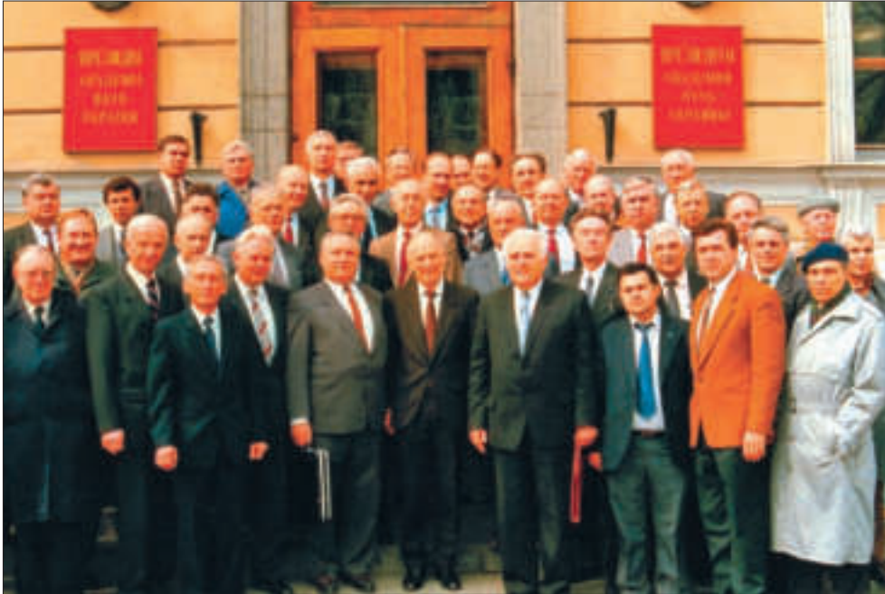
Б.Є. Патон з членами Відділення фізико-технічних проблем матеріалознавства НАН України. Київ, 1993 р.

шальне значення. Природно, що інтенсивний розвиток гуманітарних наук і установ став академічним пріоритетом, оскільки і світовий пріоритет — людський розвиток — має свої базові корені в гуманітарних чинниках.