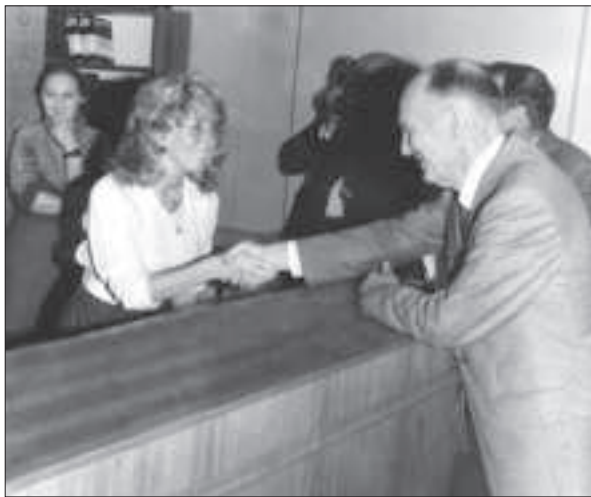
Б.Є. Патон на відкритті новозбудованого корпусу Центральної наукової бібліотеки ім. В.І. Вернадського АН УРСР. Київ, 1989 р.

шим ставав спектр міждисциплінарних досліджень і видань.