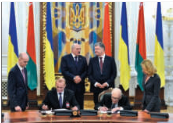
Б.Є. Патон і В.Г. Гусаков підписують Угоду про наукову співпрацю між Національною академією наук України і Національною академією наук Білорусі. Київ, 2017 р.

Флагманом наукової селекції хлібних злаків в Україні є визнаний міжнародною спільнотою Інститут фізіології рослин і генетики на чолі з академіком В.В. Моргуном. Створені в Інституті сорти озимої пшениці Смуглянка, Золотоколосо, Фаворитка та Астарта вперше за всю історію України дали рекордні врожаї зерна — 132 ц/га 23 . Інститут зареєстрував 145