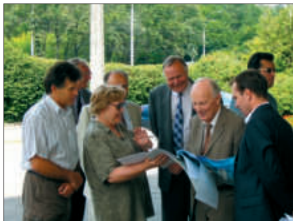
В Інституті молекулярної біології і генетики НАН України. Київ, 2007 р.

стиль набув загальноакадемічного поширення. У технічних і природничих науках він означав прагнення до максимального скорочення шляху від наукового результату через експеримент до виробничого продукту, а в соціогуманітаристиці — через оприлюднення наукових ідей і поглядів до закріплення їх у масовій свідомості. Як і у творенні нових знань, технологій і технічних винаходів, Б.Є. Патон постійно націлює наукове співтовариство на пошук нових форм впроваджувальної роботи.