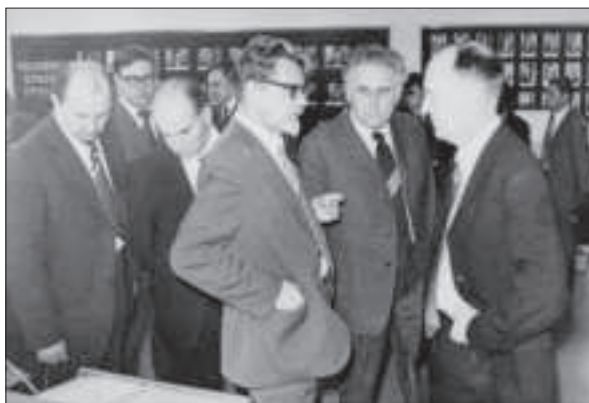
Б.Є. Патон, О.О. Галкін та І.К. Походня в Донецькому фізико-технічному інституті АН УРСР. 1975 р.

сягненнями. Уже на початку 90-х років Україну визнано одним зі світових лідерів комплексного вивчення біології клітин в умовах космічного польоту. В Інституті ботаніки ім. М.Г. Холодного за участю першого космонавта незалежної України Л. Каденюка розроблено програму комплексного біологічного експерименту в космосі. Л. Каденюк провів експериментальні дослідження на борту американського космічного апарата «Спейс Шатл». Вивчалось архіважливе питання: розвиток рослин як одного з елементів системи життєзабезпечення майбутніх довготривалих космічних місій.