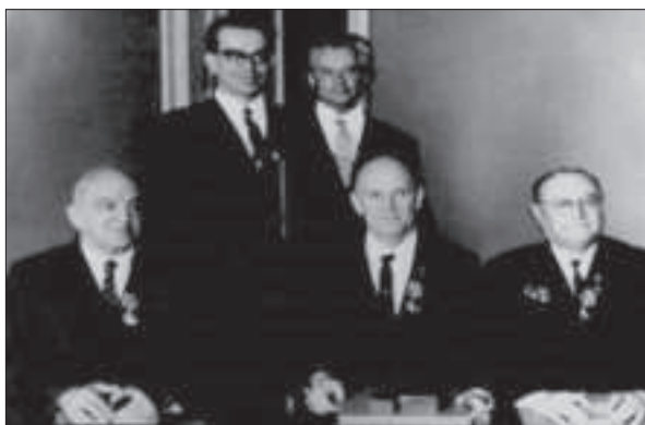
Після вручення орденів Леніна і Золотих медалей «Серп і Молот». У першому ряду (зліва направо): академіки О.І. Бродський, Б.Є. Патон, З.І. Некрасов; у другому ряду: академіки В.М. Глушков та І.М. Францевич. 1969 р.

тичні школи, завдяки яким в Академії виростили нові структури. У 1965 р. створено Донецький обчислювальний центр, що 1970 р. переріс в Інститут прикладної математики і механіки, а у Львові в 1978 р. — Інститут прикладних проблем механіки і математики (нині — ім. Я.С. Підстрига).