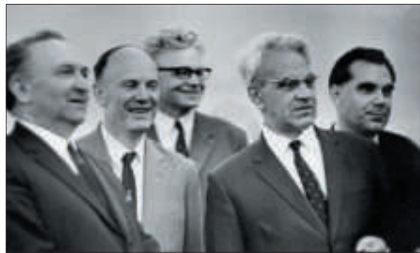
Делегація на чолі з президентом АН СРСР академіком М.В. Келдишем та президентом АН УРСР академіком Б.Є. Патоном під час відвідування павільйону «Наука» Виставки досягнень передового досвіду в народному господарстві УРСР. Київ, 1969 р.

України, ДП НАЕК «Енергоатом», Державним концерном «Укроборонпром». НАН України взяла активну участь у формуванні Національного комітету з промислового розвитку України, його робочих груп з наскрізних та галузевих тематик. При НАН України створено міжвідомчу координаційну групу для забезпечення вироблення узгодженої позиції щодо Стратегії розумних спеціалізацій Євросоюзу.