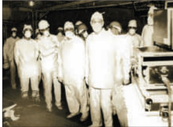
Б.Є. Патон на Чорнобильській АЕС. 1990 р.

Уже на основі перших даних про характер аварії на ЧАЕС учені Академії зробили висновок, що ліквідація її наслідків — справа складна, тривала і потребує об'єднання зусиль наукових, державних, міжнародних організацій. Тому курс було взято на комплексну наукову і практичну програму подолання наслідків аварії. Борис Євгенович і донині є її ідейним керів-