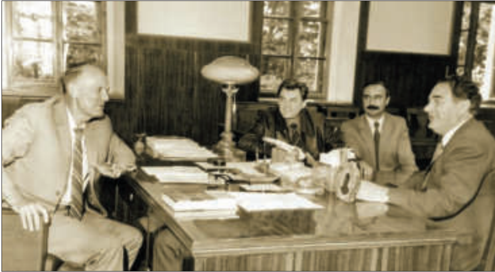
З ректором Київського державного університету ім. Т.Г. Шевченка М.У. Білим. Київ

то урядове рішення, згідно з яким усі області України було згруповано у шість регіональних наукових центрів Академії: Донецький, Західний, Південний, Північно-Західний, Північно-Східний і Придніпровський. Пізніше було створено окремий Кримський науковий центр.