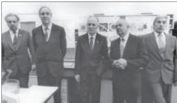
В Інституті проблем кріобіології і кріомедицини АН УРСР. Харків, 1985 р.