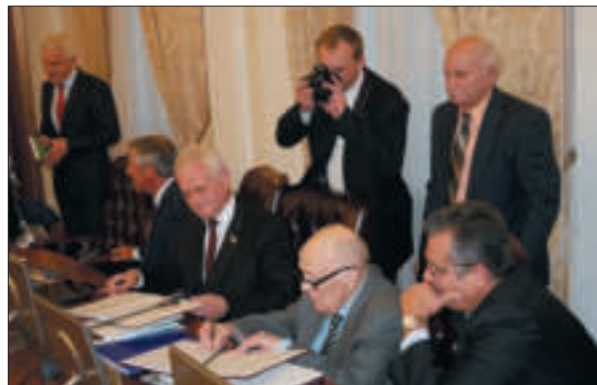
Б.Є. Патон і О.В. Співаковський підписують Меморандум про співробітництво між Національною академією наук України та Комітетом Верховної Ради України з питань науки і освіти. Київ, 2018 р.