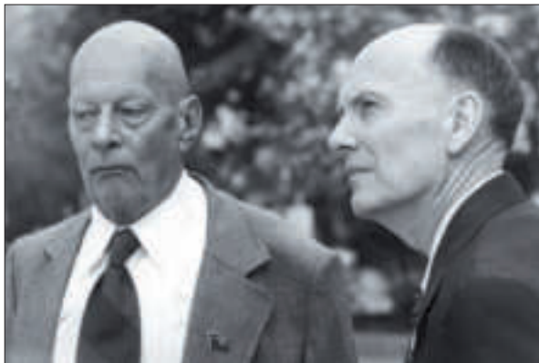
Два президенти. Президент АН СРСР академік А.П. Александров і президент АН УРСР академік Б.Є. Патон