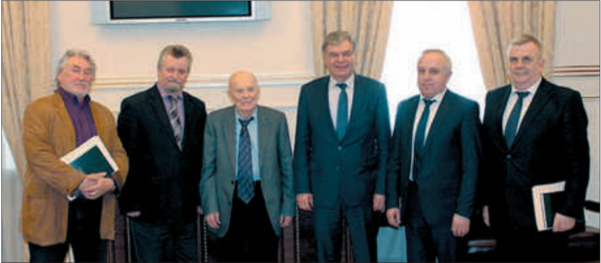
Засідання Ради президентів академій наук України. Зліва направо: президент Національної академії мистецтв України А.В. Чебикін, президент Національної академії медичних наук України В.І. Цимбалюк, Президент Національної академії наук України Б.Є. Патон, президент Національної академії педагогічних наук України В.Г. Кремень, президент Національної академії аграрних наук України Я.М. Гадзало, президент Національної академії правових наук України О.В. Петришин. Київ, 2017 р.

ціогуманітаристиці, яка стала потужним джерелом національного відродження, розбудови української державності.