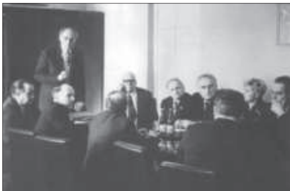
Голова Західного наукового центру АН УРСР Я.С. Підстригач розповідає про діяльність Центру. Львів, 1980 р.

Крім біологічних експериментів установи НАН України брали участь у здійсненні космічних досліджень планети Венера, Сонця, комети Галлея. При Президії НАН України з 1992 р. діє Міжнародний центр астрономічних та медико-екологічних досліджень.