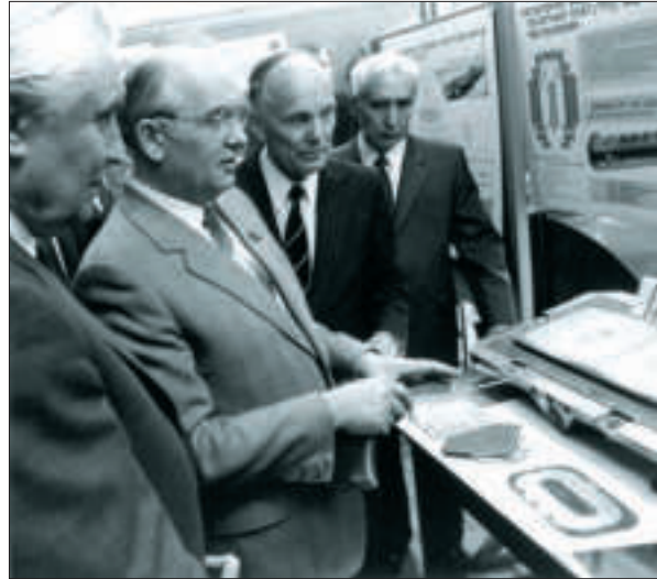
Візит М.С. Горбачова в Інститут електрозварювання ім. Є.О. Патона АН УРСР. Київ, 1985 р.

Програмою щодо цього була його доповідь «Про стан науки і її роль в економічному розвитку України» на сесії Верховної Ради України в липні 1994 р. «Шлях для України, — пропонував Борис Євгенович, — потрібно шукати виключно в орієнтації на сучасні постіндустріальні тенденції розвитку суспільства. Головна риса цих тенденцій — дедалі більш зростаюче використання інформації, знань як найважливішого виду ресурсів, який дедалі більшою мірою визначає становище та майбутнє держави. Саме капітал знань, який втілює в собі насамперед досягнення науки й техніки, має стати рушійною силою нової економіки України» 45 .