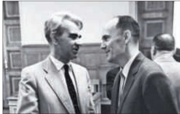
Два президенти. Президент АН СРСР академік М.В. Келдиш і президент АН УРСР академік Б.Є. Патон