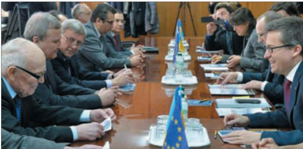
Зустріч з делегацією ЄС на чолі з комісаром Європейської комісії з науки, досліджень та інновацій К. Моедашем. Київ, 2015 р.

державним і громадським структурам, розміщують на сайтах численні інформаційні, аналітичні, прогностичні матеріали.