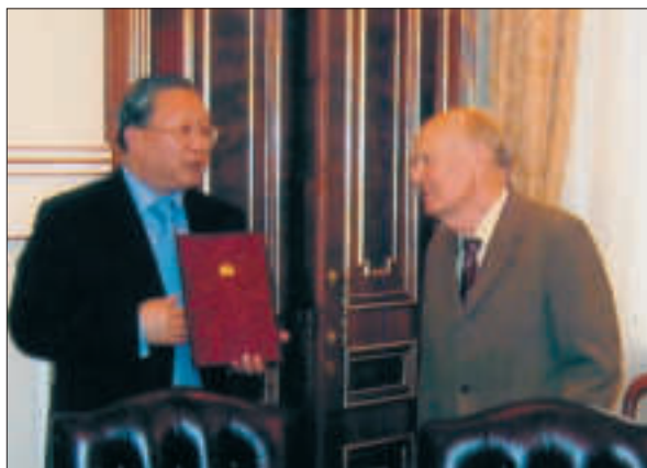
Зустріч з президентом Академії наук Китаю професором Лу Юнсянем. Київ, 2005 р.

тон, — у забезпеченні «хлібного» (в широкому розумінні — продовольчого) достатку України, внесок Академії у вирішення зростаючої світової проблеми — продовольчої безпеки. З цією метою пріоритет надається селекції нових високоврожайних сортів сільськогосподарських культур, пошуку шляхів підвищення ефективності використання земельних угідь, посиленню кормової бази тваринництва, створенню інтенсивних технологій виробництва аграрної продукції.