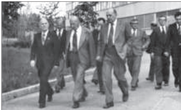
Делегація на чолі з президентом АН СРСР академіком А.П. Александровим в Інституті ядерних досліджень АН УРСР. На передньому плані: Б.Є. Патон, А.П. Александров і директор Інституту О.Ф. Німець. Київ, 1978 р.