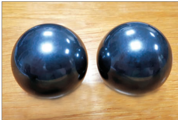
Рис. 3. Виготовлені в Інституті надтвердих матеріалів ім. В.М. Бакуля НАН України дослідні зразки керамічних (з матеріалу В4С) кульок великого розміру (діаметр 42 мм) для підшипників кочення

У 2016 р. фахівці ДП «Івченко-Прогрес» та Інституту надтвердих матеріалів ім. В.М. Бакуля НАН України узгодили основні напрями співпраці зі створення керамічних матеріалів для тіл кочення підшипників і розробили технічне завдання. У грудні 2017 р. співробітники Інституту поінформували фахівців ДП