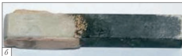
Рис. 2. Результати випробувань перспективних керамічних матеріалів для деталей гарячої частини турбогвинтових двигунів, розроблених в Інституті проблем матеріалознавства ім. І.М. Францевича НАН України: а – зразок у потоці газів пальника; б – стан зразка після 6000 циклів

технологічному зразку. Тривала міцність цього типу з'єднання становить не менш як 80% міцності основного матеріалу. Розроблено також технологію виготовлення зварних біметалевих дисків турбіни.