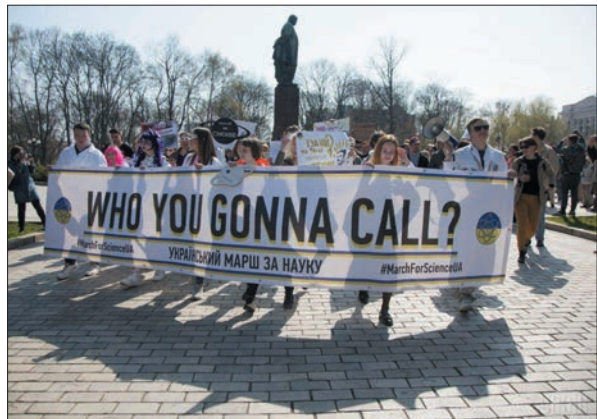
Український марш за науку. 14 квітня 2018 р.

вом «оперативно» мається на увазі не через кілька днів чи тижнів, а відразу, протягом лічених годин після її появи.