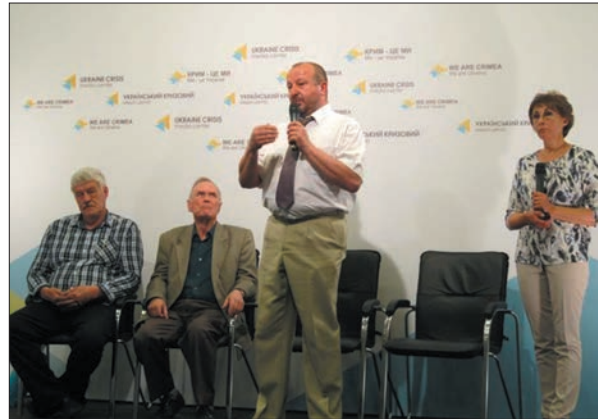
Брифінг науковців НАН України «Українські вчені для АТО: унікальні розробки, які можуть врятувати життя». Український кризовий медіа-центр. 2 червня 2015 р.

Отже, в Україні популяризація досягнень науковців Академії має на меті, по-перше, пояснити суспільству важливість науки для інноваційного розвитку людства загалом, по-друге, показати користь від діяльності науковців Академії зокрема, по-третє, розтлумачити справжні причини і джерела проблем, з якими стикається наукова сфера в Україні, і по-четверте, оперативно реагувати на маніпуляції та недостовірну інформацію, яка поширюється в ЗМІ і стосується Академії. Причому під сло-