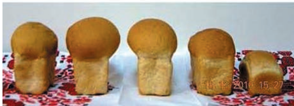
Скринінг якості хліба нових сортів озимої пшениці селекції Інституту фізіології рослин і генетики НАН України

у складі урядової делегації доповідати особисто Михайлу Сергійовичу Горбачову.