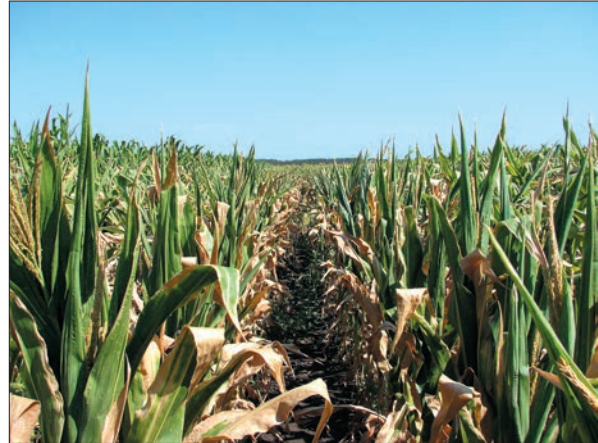
Зміни клімату. Посуха в Україні 2017 р. Більш як половина лисія всохла ще до викидання мітелок. Втрати врожаю становили 50–80 %

За роки наукової діяльності мною особисто та у співавторстві створено 145 зареєстрованих сортів і гібридів рослин. Сорти вже 40 років висіваються на полях України та країн СНД. Площа посівів цих сортів у різні роки становила від 1 до 5,5 млн га щороку. Сьогодні сорти лише озимої пшениці висіваються на