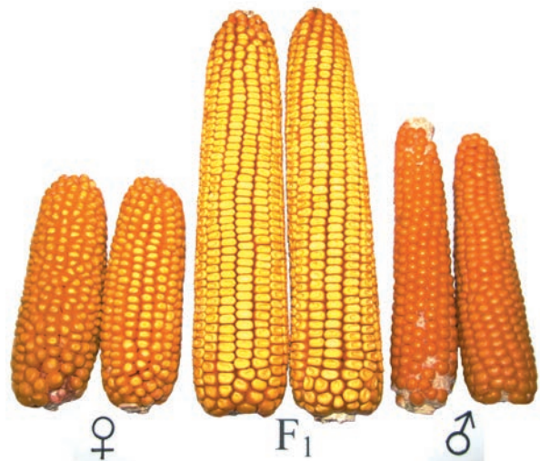
Технологія отримання гібридного насіння. Високопродуктивні качани гібрида (F 1 ) від схрещування двох самозапильних ліній (♀ × ♂)

Про виконання згаданої Постанови ЦК КПРС щодо створення ранньостиглих міжлінійних гібридів кукурудзи мені було доручено