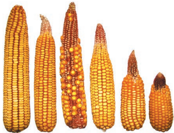
Зміни клімату. Посуха в Україні 2017 р. Зліва — качан урожаю в нормальні роки, решта качанів відображають втрати врожаю залежно від зони вирощування

площі близько 2 млн га, що становить 30 % усіх посівів цієї культури. Валовий збір зерна з наших сортів удвічі перевищує потреби України в продовольчому зерні пшениці.