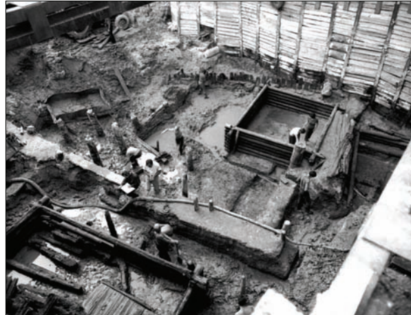
Розкопки під керівництвом П.П. Толочка зрубів X ст. на Подолі, результати яких змінили існуючі уявлення про забудову давнього Києва. 1972 р.

Чомусь багато хто вважає, що саме тоді П.П. Толочко отримав усі свої звання та нагороди. Проте згадую, як уже взимку того самого року на голови київських археологів опалися різні неприємності. Піднялася брудна хвиля боротьби проти «замилування старовиною». Серію книжок, які готувалися до ювілею і перебували вже на стадії верстки, було екстрено вилучено з видавництва для додатково-