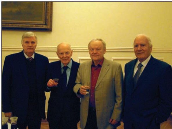
З президентом НАН України Б.Є. Патеном та академіками Б.І. Олійником і Ю.С. Шемшученком. 27 листопада 2012 р.

глянуто також взаємовідносини Русі з варягами, Хозарським каганатом і Візантією.