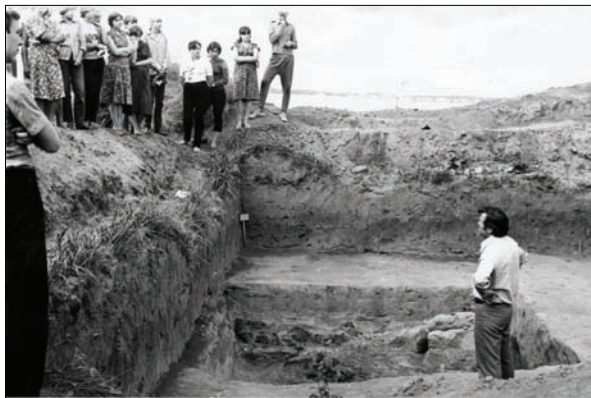
Розкопки на Старокиївській горі; екскурсія для студентів. 1964 р.