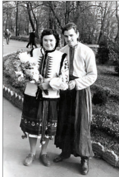
Студентські роки. 1956 р.

У 1960-х роках рішення П.П. Толочка зайнятися дослідженням Києва (за порадою В.Й. Довженка) було досить сміливим і для багатьох несподіваним. Адже тоді тільки вийшли два томи монографії М.К. Каргера «Древний Киев», яка дійсно багато в чому підбила підсумок у майже 150-річній історії археологічного вивчення Києва. Тож деякі фахівці впевнено висловлювали думку, що «після Каргера в Києві нема чого робити». Крім того, у світі археології всі добре знали авторитарну постать М.К. Каргера і його недоброзичливе ставлення до учених, які наслідувалися працювати у сфері «його питань». Проте Київ виявився невичерпним джерелом, яке науковці ще будуть досліджувати і досліджувати. У своїх роботах М.К. Каргер не створив цілісної картини давнього Києва, можливо, тому що й не ставив перед собою такого завдання. Він ґрунтовно розглянув історію досліджень міста, пам'ятки архітектури та певні категорії знахідок, і його