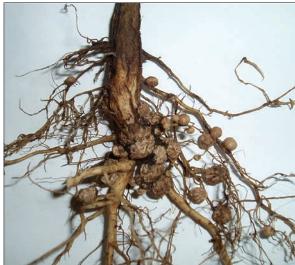
Рис. 1. Кореневі бульбочки сої ( Glycine max (Merr.))

Зернобобові (сочевиця, горох, нут і квасоля) вважаються необхідною складовою продуктового кошика будь-якої людини. Вони є життєво