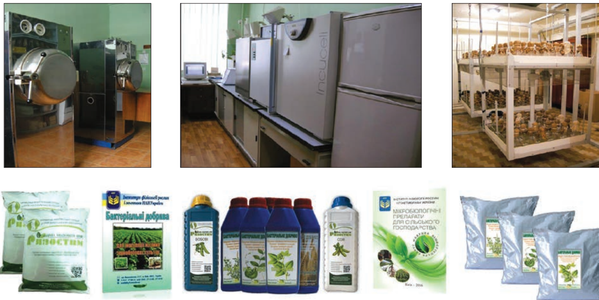
Рис. 4. Обладнання для виготовлення бактеріальних добрив та продукція Інституту фізіології рослин і генетики НАН України

подарського виробництва необхідно співпрацювати з науково-дослідними установами — оригінаторами штамів і розробниками препаратів, які видають необхідну документацію (регламент, технічні умови), а також рекомендації мікробіологічного і сировинного характеру. Завданням виробництва бактеріальних добрив є максимальне накопичення життєздатних клітин, збереження їх життєздатності на усіх стадіях технологічного процесу, приготування на їх основі готових форм препарату зі збереженням активності мікроорганізмів впродовж гарантійного терміну. Лише в такий спосіб отримані біопрепарати гарантують реальний успіх у рослинництві, неякісні ж можуть дискредитувати саму ідею біологізації землеробства.