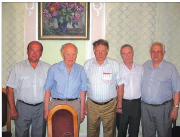
Академіки (зліва направо): А.П. Шпак, Б.Є. Патон, Ж.І. Алфьоров, А.Г. Наумоєць, В.Г. Бар'яхтар

Хочу відзначити величезний патріотизм, який проявляли вчені нашої Академії в той час. До нас в оперативну групу безперервним потоком йшли співробітники Академії з проханням дати їм будь-яку роботу з ліквідації наслідків аварії.