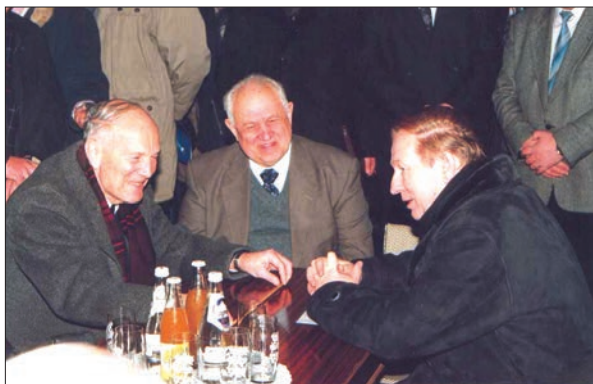
Після Загальних зборів НАН України (зліва направо) Б.Є. Патон, В.Г. Бар'яхтар, Л.Д. Кучма

горовичу, ми Вас підтримаємо, але Вам, у разі успішних виборів, доведеться попрацювати головою Донецького наукового центру. Чи згодні Ви на це?». Звісно, я подякував Борису Євгеновичу за довіру і сказав, що постараюся його не підвести. При цьому я аж ніяк не лукавив. На той час я вже досить добре був обізнаний зі справами в Центрі, і мені дійсно хотілося випробувати себе в ролі його керівника.