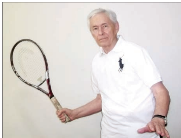
Рух — це життя