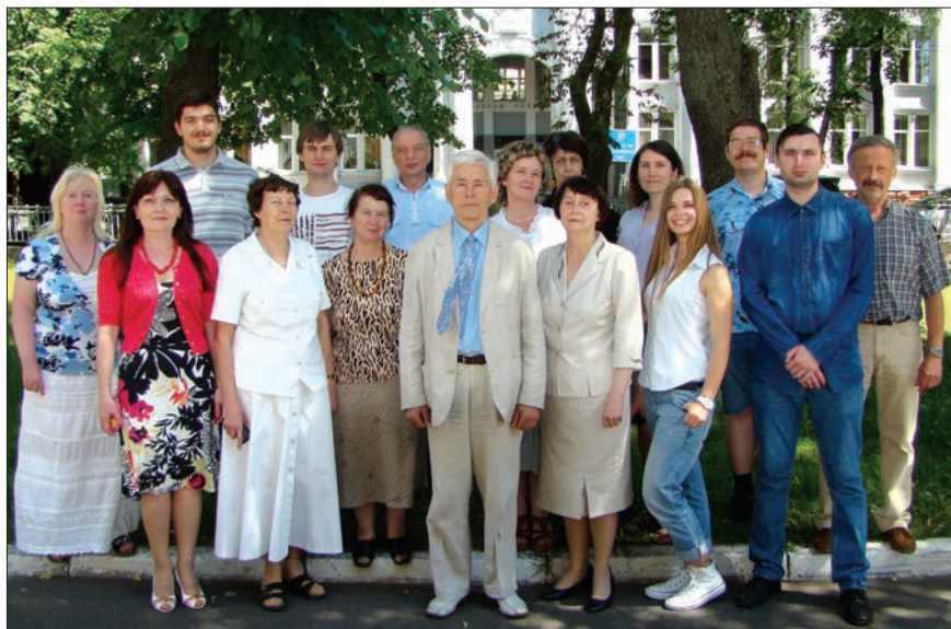
Відділ структури і функції білка Інституту біохімії ім. О.В. Палладіна НАН України

юся за ступенем активації фібриногену тромбіном. Е.В. Луговської розробив також оригінальну методику отримання фібрину desA з фібриногену за допомогою тромбіну для дослідження процесів утворення розчинного фібрину.