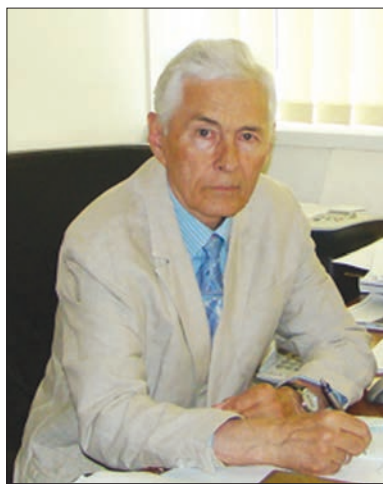
Едуард Віталійович Луговської

Сергій Васильович — академік НАН України, академік-секретар Відділення біохімії, фізіології і молекулярної біології НАН України, директор Інституту біохімії ім. О.В. Палладіна НАН України