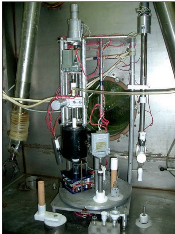
Рис. 4. Установка для виробництва капсул натрію йодиду ( ^{131}\text{I} )

Стурбованість суспільства дещо нівелюється зростанням продовольчої проблеми, зокрема необхідністю вирішення питань державного регулювання безпечності та якості харчових продуктів. Зростають потреби в консервуванні і зберіганні продуктів харчування за допомогою сучасних технологій, розробленні нових технологій, розбудові мережі сучасних лабо-