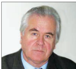
ВИШНЕВСЬКИЙ Іван Миколайович — академік НАН України, почесний директор Інституту ядерних досліджень НАН України