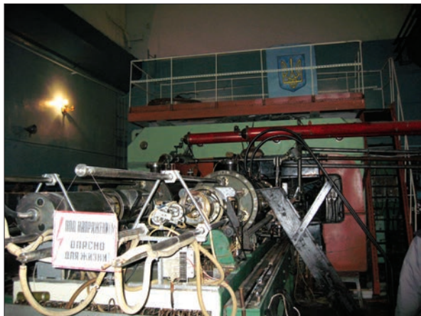
Рис. 1. Циклотрон У-120 Інституту ядерних досліджень НАН України