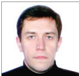
ДАВИДОВСЬКИЙ Володимир Володимирович — доктор фізико-математичних наук, завідувач відділу теорії ядерних процесів Інституту ядерних досліджень НАН України