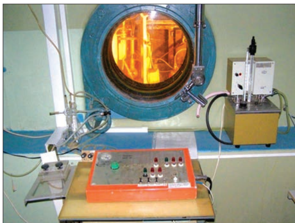
Рис. 3. Гаряча камера стаціонарного екстракційного генератора ^{99m}\text{Tc}

гію отримання елюату натрію пертехнетату- ^{99m}\text{Tc} – радіофармпрепарату, який широко використовують у ядерній медицині для діагностики пухлин різних локалізацій і непухлинної патології організму (рис. 3); технологію виробництва розчину натрію йодиду ( ^{131}\text{I} ) – радіофармпрепарату, який застосовують у ядерній медицині для діагностики і терапії раку щитоподібної залози та його метастазів; технологію виробництва капсул натрію йодиду ( ^{131}\text{I} ) (рис. 4).