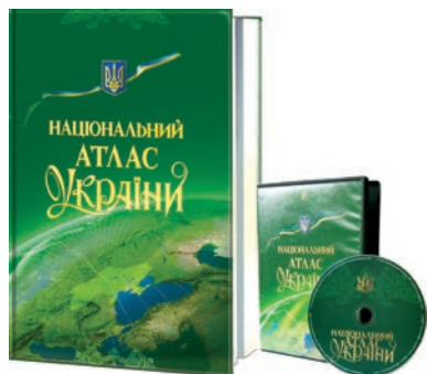
Національний атлас України та його електронне видання

Блок «Загальна характеристика» відображує місце і роль України в нових геополітичних координатах, у яких