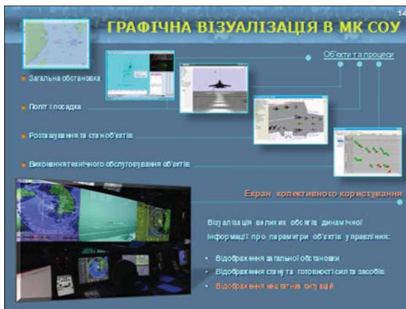
Рис. 2. Приклади інтерфейсу моделюючого комплексу СОУ