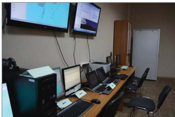
Рис. 3. Загальний вигляд комп'ютерного моделюючого комплексу

систем організаційного управління спеціального призначення [6], у яких брали участь також фахівці інших держав. У певному сенсі можна говорити про розроблення нової концепції — концепції створення моделюючих комплексів систем організаційного управління. Усі проектні рішення щодо автоматизації технологічних процесів збору, обробки, збереження та аналізу інформації для керування діями технічного персоналу та функціонуванням об'єкта автоматизації, а також організації інформаційної взаємодії між посадовими особами під час поточної діяльності чи виконання спеціальних завдань попередньо відпрацьовувалися та оптимізувалися на проблемно-орієнтованих комп'ютерних моделюючих комплексах. Високу оцінку українських і закордонних фахівців дістали комп'ютерний моделюючий комплекс для відпрацювання базових системних, конструкторських, програмних та технологічних рішень зі створення автоматизованої системи управління авіаційним комплексом; впроваджені у моделюючому комплексі технології адаптації автоматизованих робочих місць до вимог посадових осіб різних рівнів, програми тренажу і підготовки технічного персоналу та посадових осіб різних рівнів управління для вирішення завдань управління авіаційним комплексом, а також процедури моделювання взаємодії і тестування корабельних комплексів і систем відображення повітряного, надводного оточення та управління авіацією.