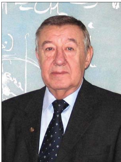
Академік НАН України Віталій Дмитрович Походенко

В.Д. Походенко дослідив будову та механізм перетворень великої кількості вільних феноксильних радикалів, що містили різноманітні замісники в різних положеннях ароматичного ядра, багато з яких було одержано вперше. Одним із найважливіших результатів цих досліджень стало створення сучасних уявлень про будову і вплив різноманітних факторів на стійкість феноксильних радикалів, кінетику і механізм їх спонтанних перетворень. У 1969 р. вийшла його перша монографія