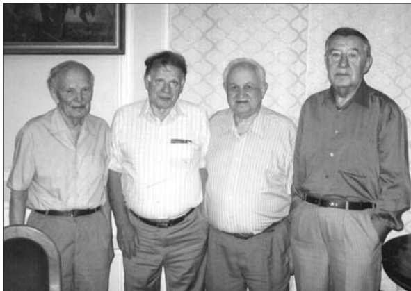
Зустріч академіків: Б.Є. Патон, Ж.І. Алфьоров, В.Г. Бар'яхтар, В.Д. Походенко. 2000-ні роки

що є поліспряженими іон-радикалами. Цей напрям зараз бурхливо розвивається у світі й у 2000 р. був відзначений Нобелівською премією. У 80–90-х роках В.Д. Походенко одним із перших у країні розпочав дослідження цих унікальних об'єктів. У результаті проведених багатопланових досліджень розроблено цілу низку оригінальних хімічних, електрохімічних, іон-імплантаційних та інших методів одержання нових ЕПП, а також методів їх добування з отриманням матеріалів n - і p -типу, електрична провідність яких може змінюватися в широких межах і досягати провідності металів; детально вивчено їхні фізико-хімічні, електрохімічні, електрофізичні, фотохімічні властивості, магніторезонансні та спектральні характеристики.