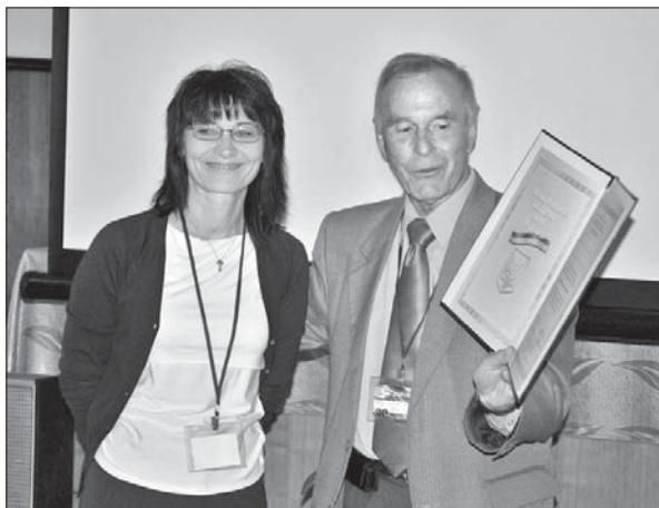
Віце-президент НАН України академік А.Г. Наумо- вель і голова Науково-видавничої ради НАН України академік Я.С. Яцків вручають нагороди працівникам ВД «Академперіодика»

книжкові видання Видавничого дому на все- українських та міжнародних конкурсах і ви- ставках».