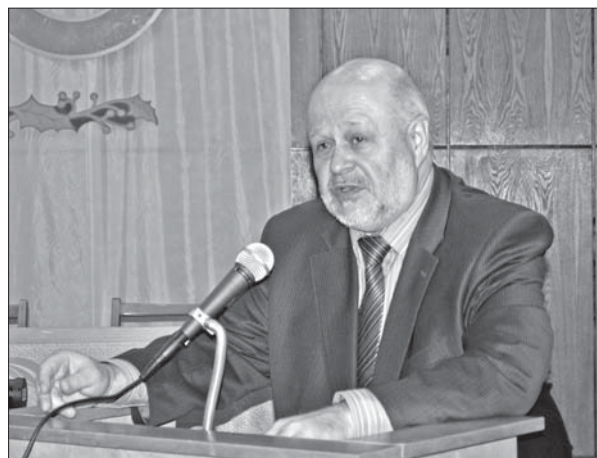
Виступ члена-кореспондента НАН України В.І. Попика