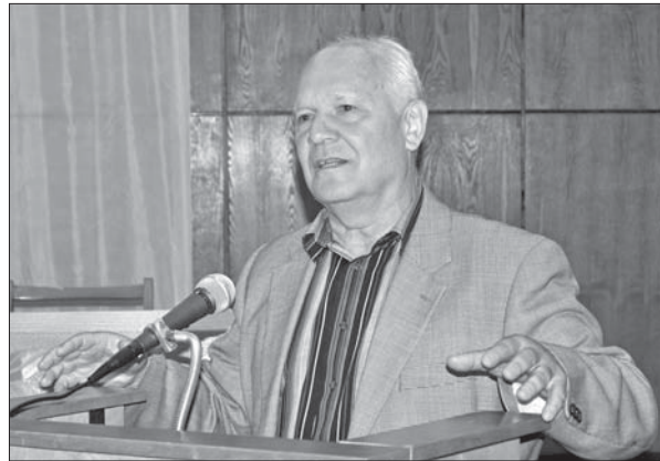
Виступ академіка НАН України В.М. Локтева

Наукову частину конференції було відкрито двома майстер-класами. Перший — «Оформлення пристатейних списків літератури. Використання reference-manager» — на замовлення ВД «Академперіодика» НАН України