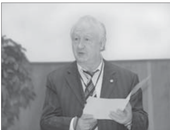
Голова Ради з книговидання при МААН член-кореспондент РАН В.І. Васильєв зачитує звернення президента РАН академіка РАН Ю.С. Осипова до учасників сесії

У зверненні академіка РАН Ю.С. Осипова сказано: «Ефективність міжнародного наукового співробітництва сьогодні значною мірою визначається налагодженням та забезпеченням оперативного доступу до наукової інформації, рівнем розвитку та продуктивністю функціонування робочих зв'язків, дієздатністю форм і каналів, що допомагають організувати взаємодію... Розгляд під час вашої роботи питань наукового книго-