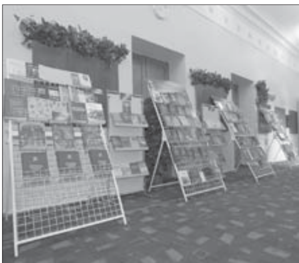
Експозиція Міжнародної книжкової виставки «Наука — освіті»

У зверненні академіка РАН Ю.С. Осипова сказано: «Ефективність міжнародного наукового співробітництва сьогодні значною мірою визначається налагодженням та забезпеченням оперативного доступу до наукової інформації, рівнем розвитку та продуктивністю функціонування робочих зв'язків, дієздатністю форм і каналів, що допомагають організувати взаємодію... Розгляд під час вашої роботи питань наукового книго-