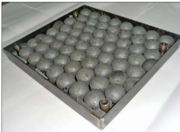
Рис. 5. Напівкульки з карбіду кремнію для виготовлення кераміко-композиційних броньових блоків