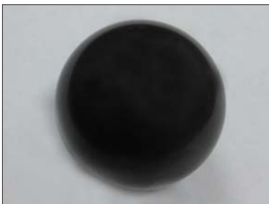
Рис. 3. Прецизійна керамічна кулька для підшипників

Цю розробку впроваджено на підприємстві ТОВ «Луцький ремонтний завод «Мотор».