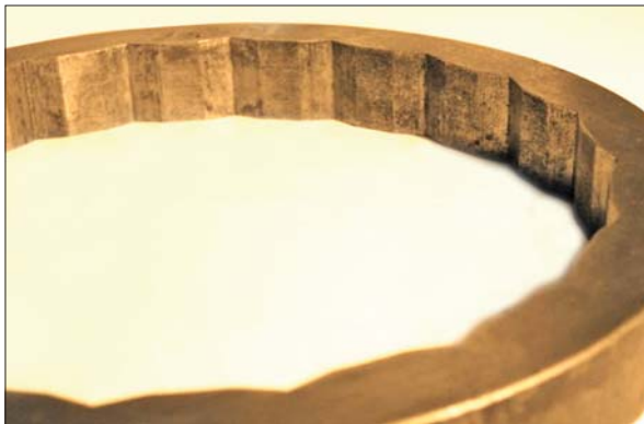
Рис. 6. Фрагмент осколкової сорочки авіаційної бомби