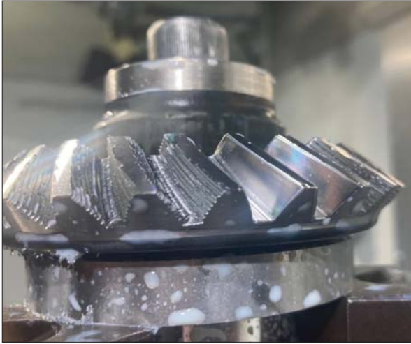
Рис. 1. Елемент зубчастого колеса редуктора, виготовлений за розробленою технологією зі спеціальних сплавів