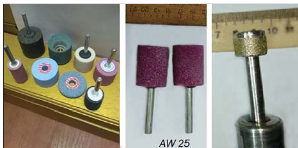
Рис. 4. Інструмент для фінішної механічної обробки наплавлених деталей

Ці технології можна застосовувати й для виготовлення осколкової сорочки авіацій-