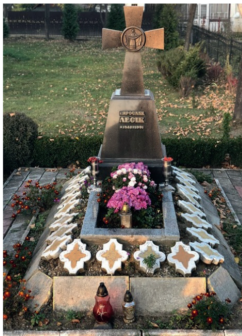
Ілюстр. 8. Могила Я.Лесіва в Болехові