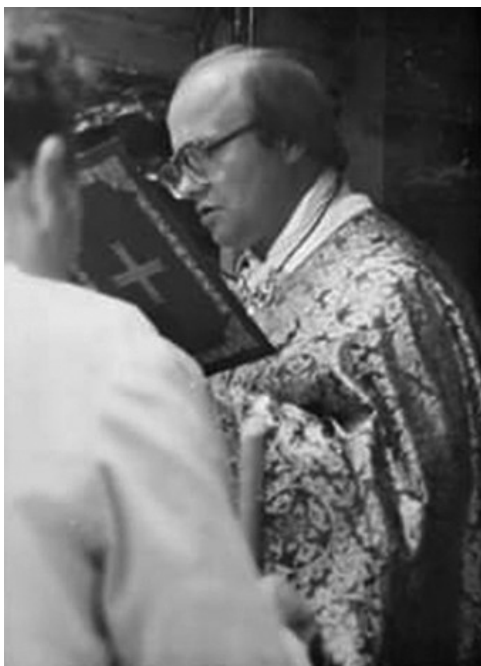
Ілюстр. 7. «Отець Сонечко» на богослужінні