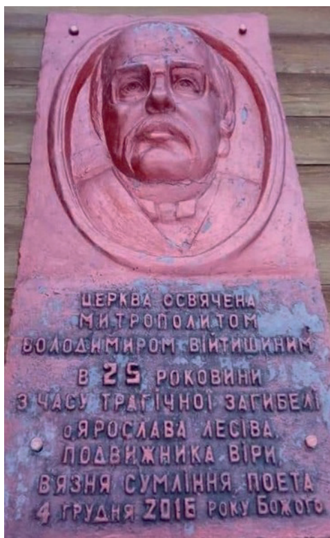
Ілюстр. 9. Пам'ятна дошка отцеві Ярославові Лесіву на стіні церкви у с. Лужки