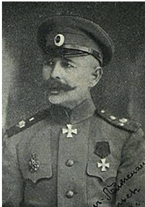
Віктор Савельєв (Савеліїв)

Із приходом до влади гетьмана П.Скоропадського полковник В.Желіховський зберіг свою посаду начальника Окремого корпусу кордонної охорони. У липні 1918 р. його змінив генеральний хорунжий В.Савельєв (Савеліїв), а того вже під завісу гетьманату – військовий старшина Васильєв. Начальником штабу ОККО був генеральний хорунжий Л.Байков. Полковника В.Желіховського перевели на посаду помічника начальника корпусу.