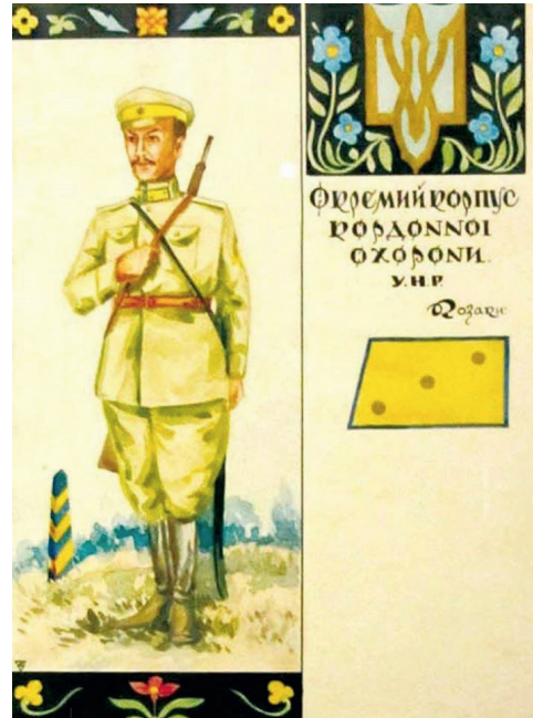
Уніформа козака Окремого корпусу кордонної охорони (проект 1922 р., відтворений на основі проєктів 1918 р.)

Тим часом 29 квітня 1919 р., коли В.Желіховського було призначено командувачем Північної групи Дієвої армії УНР, він забрав із собою до Рівного ще й кількох старшин ОККО зі ще наявних на той час уже неповних за складом бригад. Зрештою, коли на початку травня того року червоні захопили Кам'янець-Подільський, вояки Курської й Північної кордонних бригад, куди на службу саме набиралося поповнення, потрапили в полон. Частина прикордонників 1919 р. разом із залишками армії опинилася в Польщі в таборах для інтернованих.