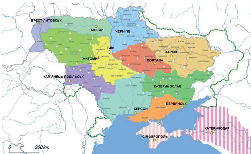
Кордони та адміністративно-територіальний поділ Української Держави (1918 р.)

Запроваджені Центральною Радою кордонні комісаріати-агентури за гетьманату продовжили своє існування. Паралельно з ними уряд Української Держави вживав заходів зі створення мережі митних пунктів та організації охорони державного кордону країни 32 .