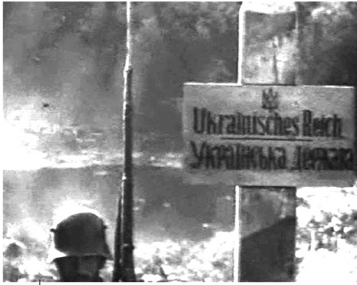
Кордон Української Держави з радянською Росією (1918 р.)

Волочиськах (малися на увазі містечка Волочиськ і Підволочиськ – П.Г.Н. ), Збаражі, Радивілові, Голобах, Маневичах, Лунинці (нині Білорусь), Ямполі, Рибниці (нині Молдова), Могилеві-Подільському і в Тирасполі (нині Молдова)» 43 . На ремонт наявних будівель митного відомства передбачалося виділити 164 тис. крб 44 .