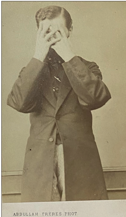
Ил. 1. Художник Станіслав Хлебовський