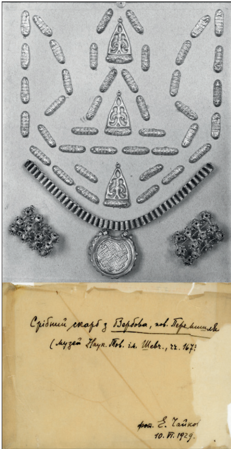
Ил. 3. Срібний скарб із Музею НТШ, знайдений у с. Вербів Перемишлянського повіту (фото 1929 р.)

шицьких представлено декількома фотокартками, з яких на двох зображено колекцію кременіних та кам'яних сокирок із Переволода 23 .