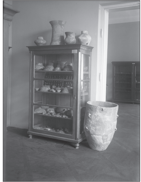
Ил. 2. Частина експозиції археологічного відділу Музею НТШ (фото 1937 р.)

Основу групи «Фондові колекції» складають предмети, які перебували у фондах Музею НТШ. Однак серед цієї категорії склопластин є екземпляри,