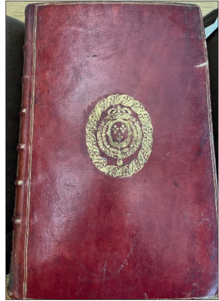
Ил. 1. Обкладинка тому французького дипломатичного листування 1712 р. (AD, CP, sous-série «Turquie», vol. 51)