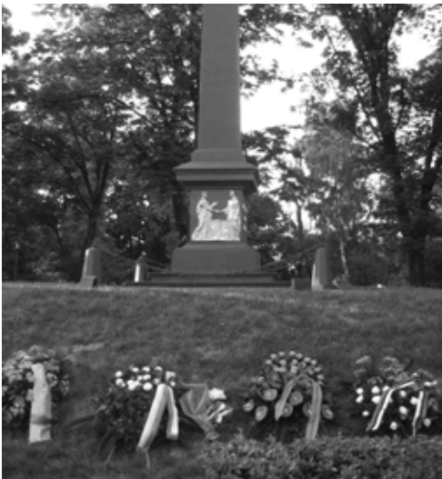
Монумент на честь Люблінської унії (Люблін, 2 липня 2009 р.)