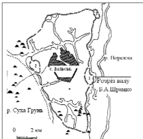
Мал. 1. Загальна схема Більського городища. 1 – Східне укріплення; 2 – Західне укріплення; 3 – Куземинське укріплення

Більське городище – видатна пам'ятка воєнно-інженерного мистецтва наших пращурів, що населяли територію України за скіфського часу. Могутність і досконалість його оборонних споруд є показником високої організації скіфського суспільства, важливого значення воєнної справи в їхньому житті. Нічого подібного більш не створювалось аж до часів Київської Русі.