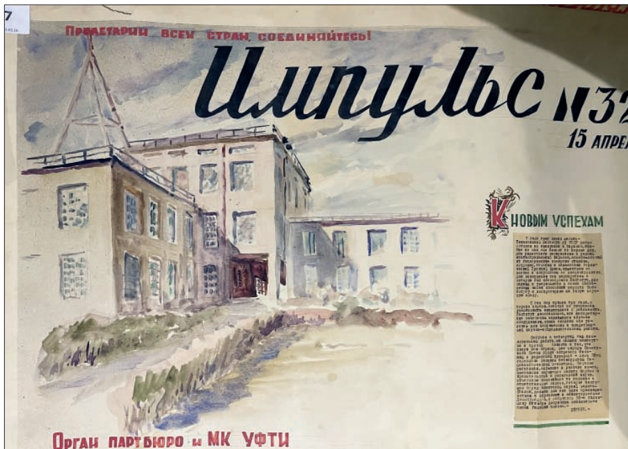
Ил. 2. Фрагмент стінної газети ХФТІ «Импульс» № 32-(6), 1947 р. (Відомчий науково-технічний музей ННЦ «ХФТІ». Ф. WR. Од. 1398)