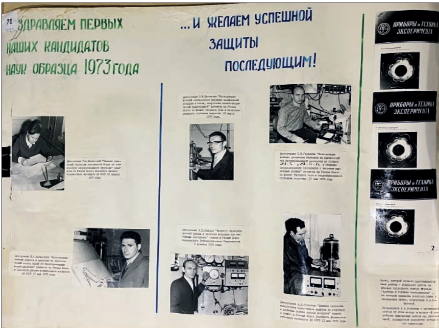
Іл. 5. Фрагмент стінної газети ХФТІ. 1973 р.