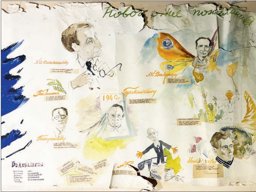
Іл. 4. Фрагмент стінної газети ХФТІ «Імпульс» № 48-(22). 1949 р. (Відомчий науково-технічний музей ННЦ «ХФТІ». Ф. WR. Од. 1394)