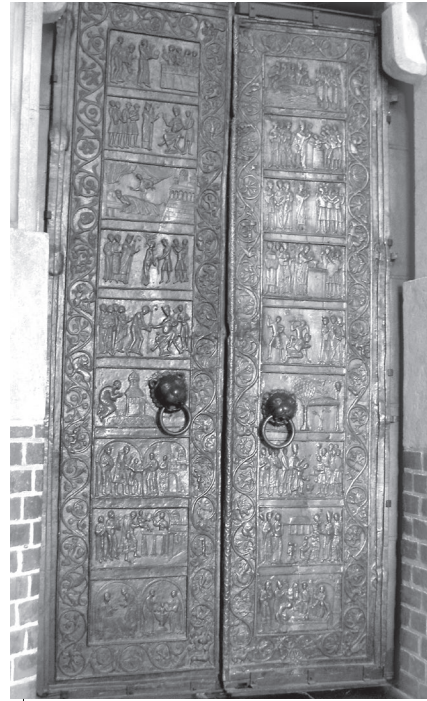
Ілюстр.4. Двері Гнезненського кафедрального собору

Повертаючись до суто київських реалій, зауважимо дещо сумбурний сюжет про хрещення київського князя Володимира, названого Литвином ще й володарем «стольного града Корсуня» 69 . Тут-таки йдеться про двері, які потрапили з Києва до гнезненської кафедри. Коментатори трактату при цьому згадують про так звані «корсунські врата» – хоча ті, як відомо, із середини XV ст. прикрашали новгородський Софійський собор, де їх впевнено локалізували С.Герберштайн і М.Стрийковський 70 (див. ілюстр.3). Натомість Литвин мав на увазі усну традицію про київські Золоті ворота, нібито вивезені до Гнезна (насправді двері тамтешньої кафедри зі сценами з життя св. Войцеха за спеціальним замовленням близько 1175 р. виготовили німецькі майстри; див. ілюстр.4).