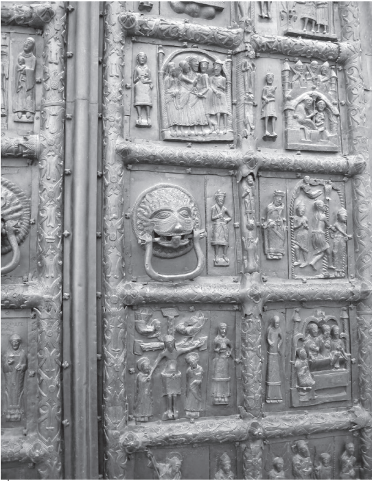
Ілюстр.3. Корсунські врата. Софійський собор (Новгород).