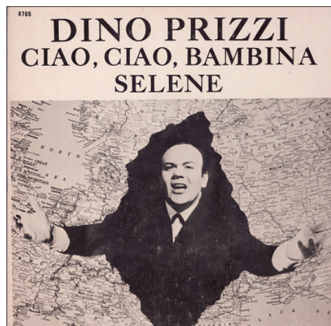
Ил. 3. Обкладинка платівки Діно Пріцци (1970-ті рр., Канада) [7]

У другій половині 1960-х рр. Епіфаніо та Марія Пріцци вирішили остаточно розпрощатися з СРСР і повернутися в Австралію. Втім українці заборонили покинути Радянський Союз, водночас дозволивши це її чоловікові-італійцю. Причому влада, якщо співак усе ж таки залишиться, обіцяла йому блискучу кар'єру тенора у всесоюзному масштабі. «Нахаба» натомість звернувся по допомогу до австралійського посольства. Спочатку у сімейства Пріцци нічого не виходило з виїздом, австралійці не квапилися. Тож подружжя ще чотири роки перебувало в невизначеній ситуації, добиваючись права повернутися в Австралію [9].