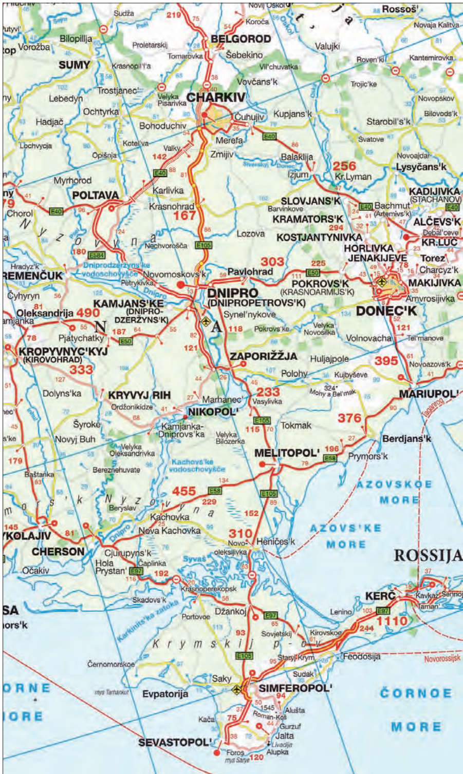
Іл. 8. Фрагмент карти автомобільних шляхів Європи з атласу Німеччини та Європи (Марсо Ролю, 2023)