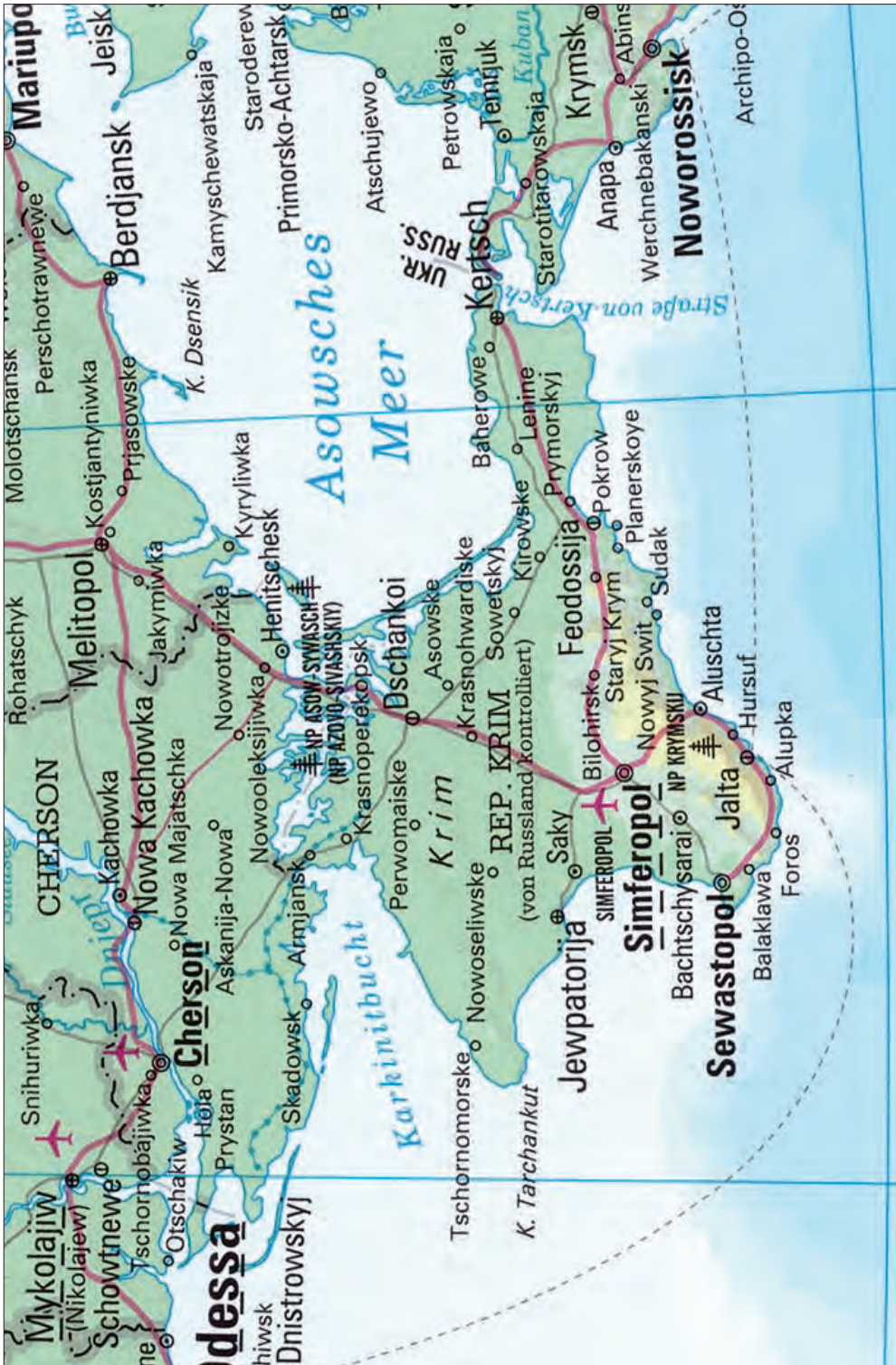
Іл. 1. Фрагмент загальногеографічної карти Південно-Східної Європи та Кавказу з «Нового атласу світу Месра» (Меуєрс, 2021)