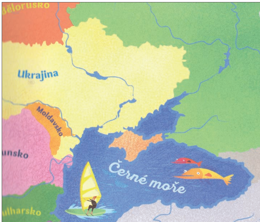
Ил. 9. Фрагмент політичної карти Європи з ілюстрованого атласу для дітей (Slovart, 2018)