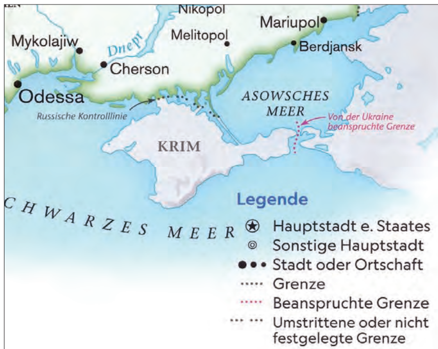
Ил. 10. Фрагмент карти Східної Європи з дитячого атласу світу (National Geographic Partners, LLC, 2022)