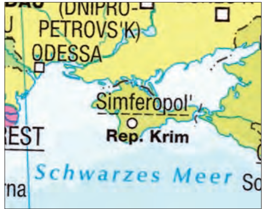
Іл. 3. Фрагмент політичної карти світу (Mair-Dumont, 2021)

Російський наратив щодо статусу Криму подається в дитячому атласі світу від американського Національного географічного товариства. В його німецькій редакції 2022 р. 38 послідовно відображено російську належність півострова.