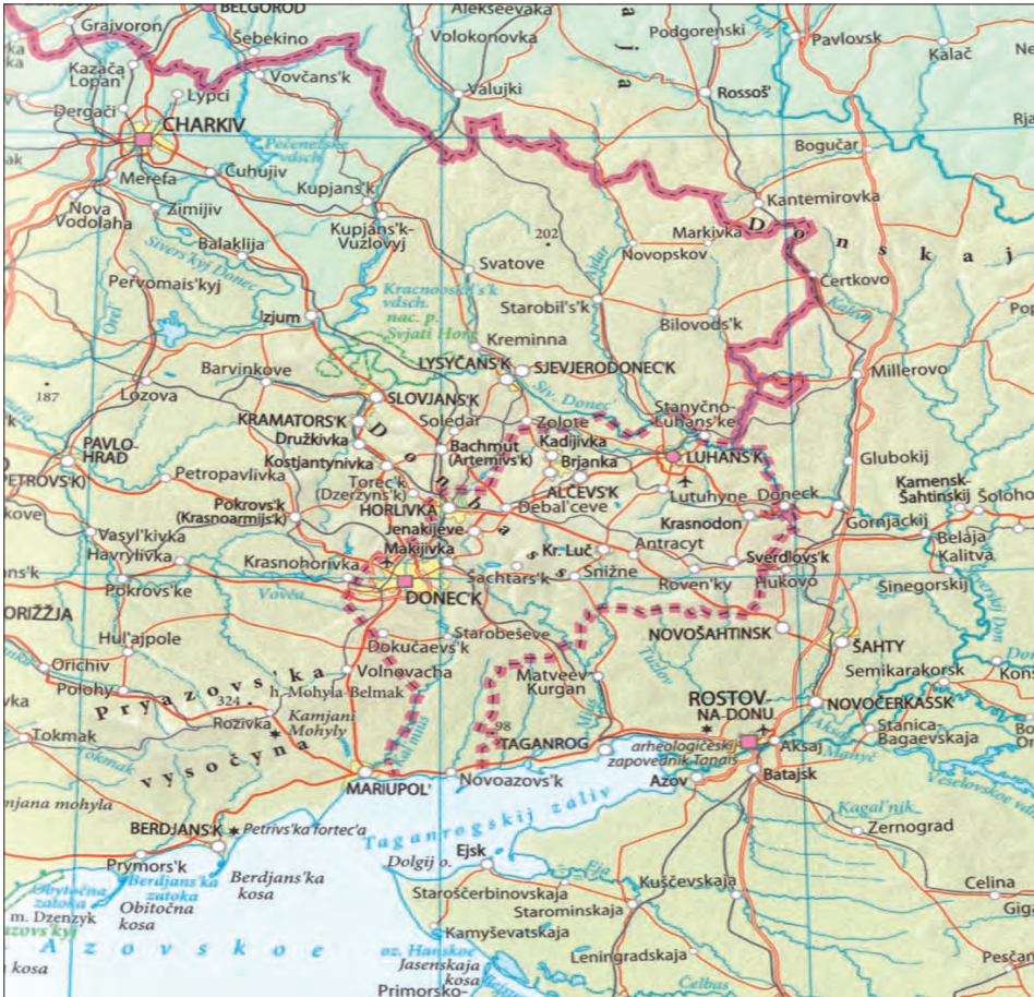
Л. 6. Фрагмент загальногеографічної карти Південно-Східної Європи з атласу світу (DuMont Reiseverlag, 2023)