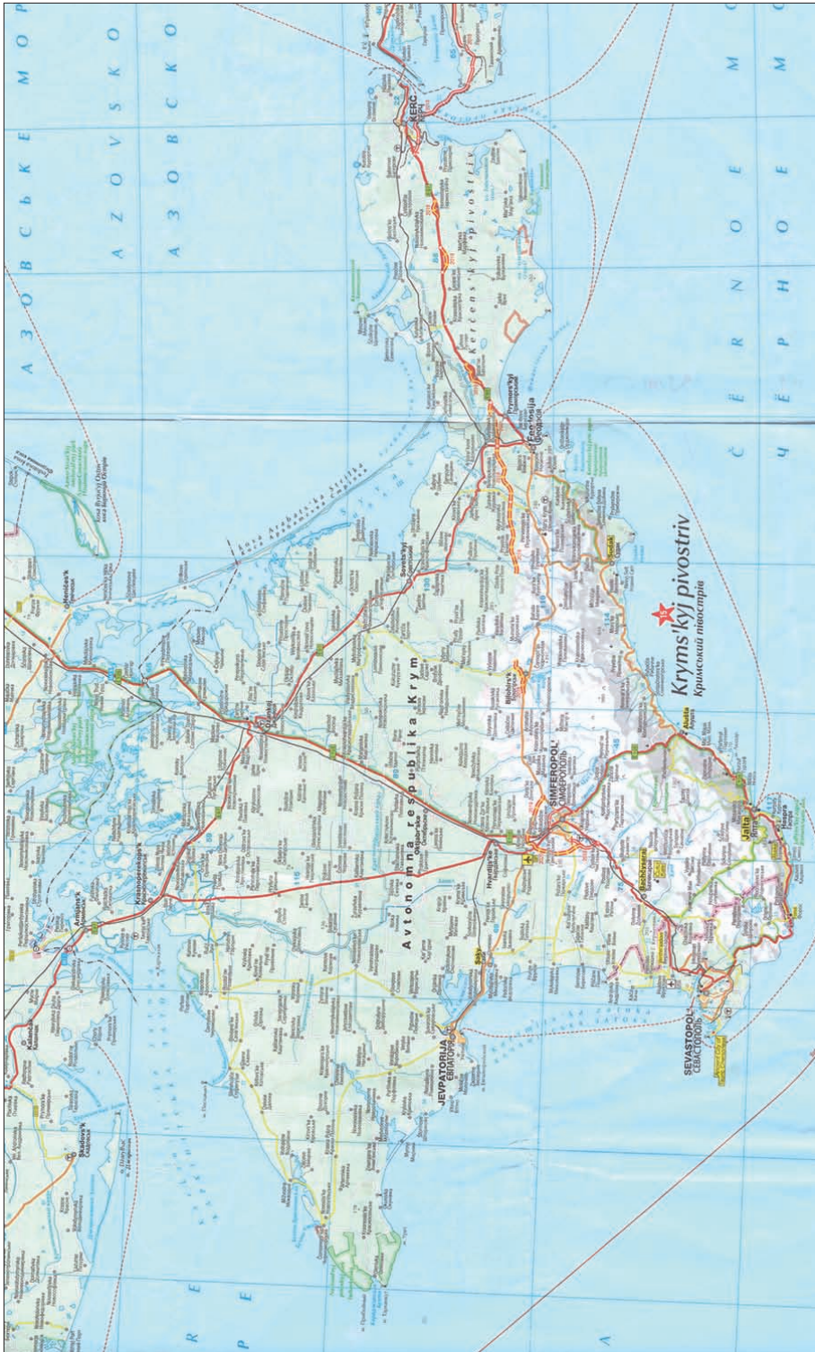
Ил. 2. Фрагмент карти автомобільних шляхів України (Магсо Роло, 2018)