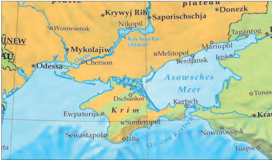
Л. 5. Фрагмент політичної карти Європи (Freitag-Berndt und Artaria KG, 2017)