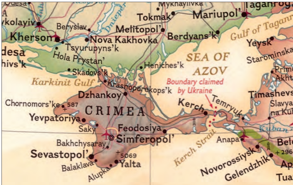
Іл. 7. Фрагмент політичної карти Європи (National Geographic Partners, LLC, 2019)

На дрібномасштабних тематичних картах світу, включно з політичною картою, Крим показаний як складова частина РФ — на півночі нанесено знак державного кордону, а в Керченській протоці він відсутній. На політичних картах Європи 39 і Східної Європи 40 більшого масштабу Крим відмежований від іншої території України умовним знаком спірного або невизначеного кордону з пояснювальним підписом «Російська контрольна лінія». Натомість у Керченській протоці розміщено спеціальний умовний знак кордону, доповнений пояснювальним текстом «Кордон, на який претендує Україна» (іл. 10).