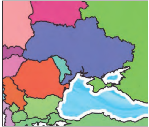
Іл. 11. Фрагмент обкладинки книжки-розмальовки та робочого зошита для дітей (M&M Baciu, 2022)

Окремої уваги заслуговує зображення Криму на глобусах — популярному картографічному продукті для дітей і дорослих. На багатьох із них також тенденційно