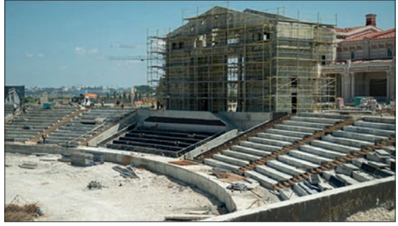
Лл. 2. Будівництво амфітеатру на території Херсонеса