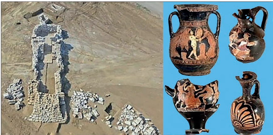
Лл. 4. Госпітальний курган і знахідки з нього