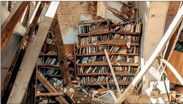
Ил. 11. Чернігівська обласна бібліотека для юнацтва