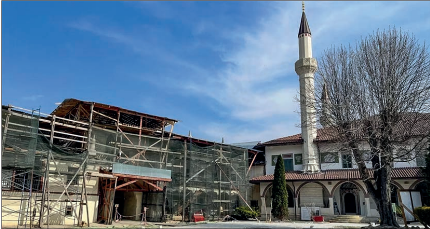
Лл. 3. Ханський палац у Бахчисараї