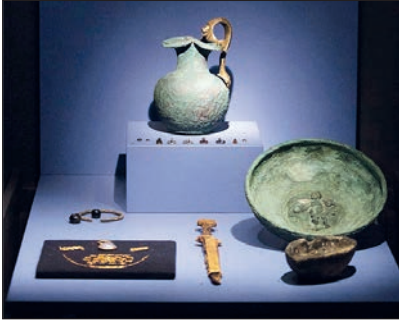
Лл. 1. Експонати з України, виставлені в Музеї Алларда Пірсона (Амстердам, 2014 р.)