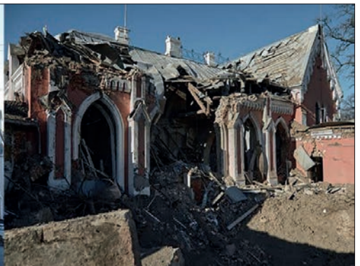
Ил. 9. Чернігівська обласна дитяча бібліотека (колишній будинок В. Тарновського, XIX ст.)