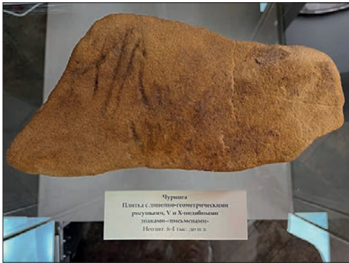
Ил. 7. Чуринги з Кам'яної Могили на виставці у Херсонесі