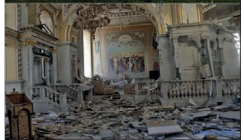
Ил. 8. Спасо-Преображенський кафедраль- ний собор (Одеса) ▶