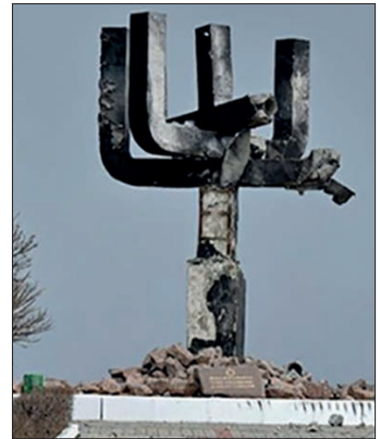
Ил. 12. Меморіал жертвам Голокосту у Дробицькому Яру