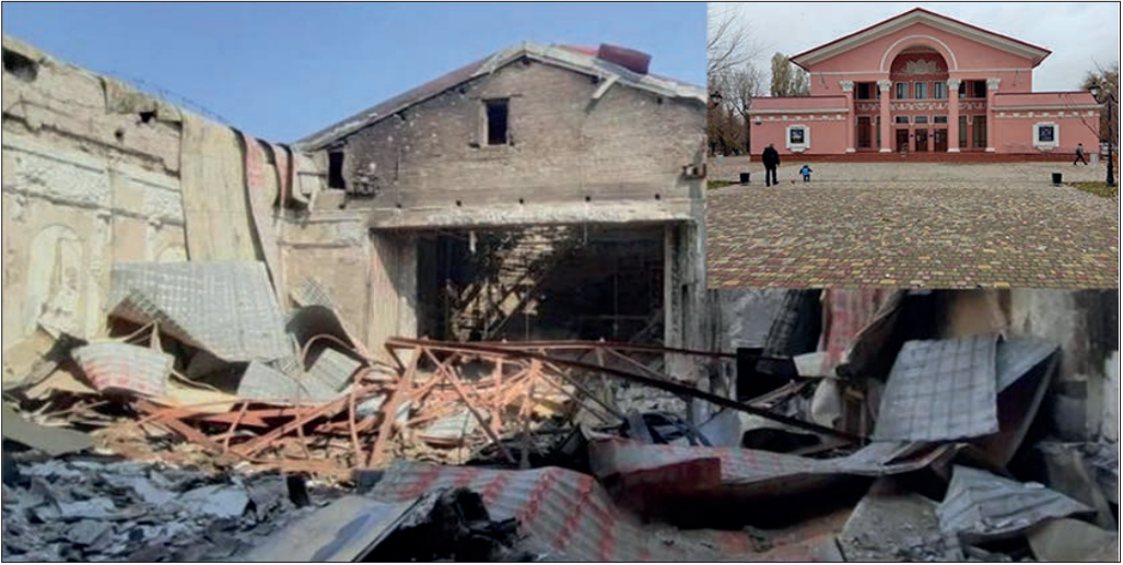
Ил. 10. Будинок культури в м. Ірпінь