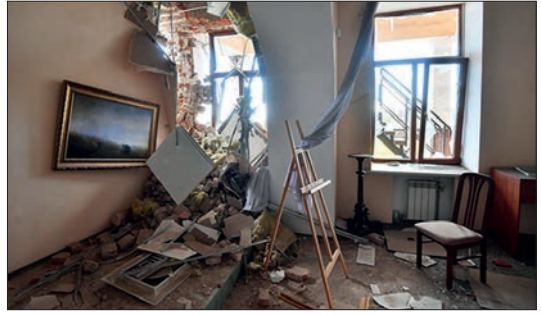
Ил. 6. Художній музей ім. А. Куїнджі (Маріуполь)