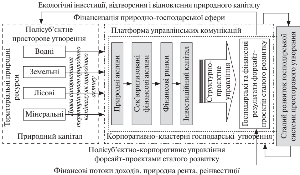
Рис. 1. Алгоритмічна схема концепту організації сталого господарювання за проективно-діяльнісним підходом