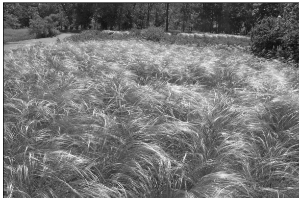
Рис. 3. Види роду Stipa L. у колекції Криворізького ботанічного саду

Провівши созологічний аналіз видів роду Stipa та опрацювавши великий масив інформації, ми визначили фітосонологічні категорії видів ковили. Під загрозою зникнення в Україні знаходяться два види: Stipa anomala та S. transcarpatica . До категорії вразливих віднесено 9 видів: S. borysthenica ; S. dasyphylla ; S. disjuncta ; S. grafiana ; S. pennata ; S. poëtica ; S. syreistschikowii P. Smirn.; S. tirsia Steven; S. zalesskii Wilensky. Види, про які відомо, що вони можуть належати до категорії зникаючих, вразливих або рідкісних, але не віднесені до цих категорій у зв'язку із відсутністю інформації, проте більш-менш широко розповсюджені в різних регіонах України, включені до категорії неоцінені : S. brauneri (Pacz.) Klokov; S. capillata ; S. lessingiana ; S. lithophila ; S. ucrainica . Решта видів: S. adoxa ; S. asperella ; S. brachyptera ; S. donetzica ; S. fallacina ; S. graniticola ;