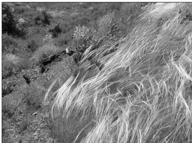
Рис. 4. Stipa ucrainica (ковила українська) на рекультивованому відвалі Першотравневого рудоуправління (м. Кривий Ріг)

В основу побудови колекції нами були покладені фітоценотичний, флористичний, популяційний, систематичний, екологічний, естетичний принципи та використані такі методи та прийоми, розроблені для збереження рідкісних та зникаючих рослин природної флори: