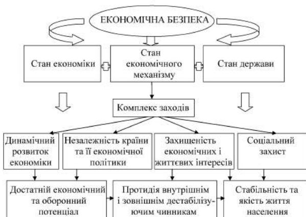
Рис. 1. Категорія «економічна безпека»

На нашу думку, можна зробити висновок, що економічна безпека це — стан економічного механізму, якому відповідає певний стан економіки та держави, коли шляхом використання комплексу заходів забезпечується незалежність, динамічний розвиток економіки, захист економічних і життєвих інтересів країни та соціальний захист громадян. Як результат формується достатній економічний і оборонний потенціал, здатність протистояти і протидіяти дестабілізуючим чинникам, що, у свою чергу, призводить до підвищення якості життя населення країни (рис. 1).