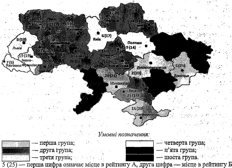
Рис. 2. Розподіл областей України за результатами кластерного аналізу у 2010 р. (розроблено автором)

останньому — Донецька. Це пов'язано з рівнем концентрації промисловості, що зумовлює величину валового регіонального продукту і, відповідно, забруднення навколишнього природного середовища. Необхідно чітко розуміти, що позитивна ситуація в деяких регіонах викликана не ефективністю природоохоронної діяльності, а відсутністю брудних виробництв.