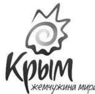
Рис. 2. Некоторые примеры брендов украинских территориальных единиц

В-шестых. Не проводится работа с населением, на местах не сформированы постоянно действующие системы обратной связи для выявления проблемных точек, а также для быстрой передачи снизу вверх перспективных идей.