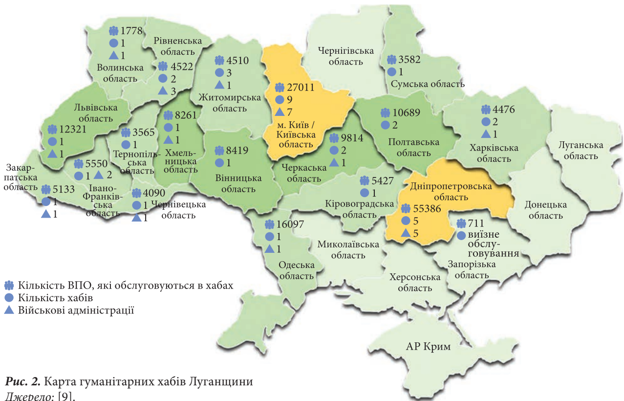
Рис. 2. Карта гуманітарних хабів Луганщини Джерело: [9].

туальність функцій підрозділів ОМС і трансформувати їх відповідно до сучасних потреб громади, зосередивши ресурси на ключових напрямках: освіті, охороні здоров'я, соціальному захисті, культурі, комунікаціях, плануванні та розвитку стійкості.