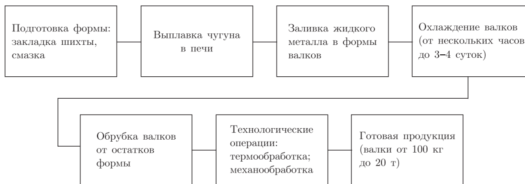
Рис. 1. Принципиальная схема технологии производства чугунных валков

Постановка задачи исследования. Для периодического технологического процесса до начала реализации его основного цикла с учетом возможных изменений качества исходного материала требуется разработать метод прогнозирования допустимо точных значений показателей качества целевого продукта.