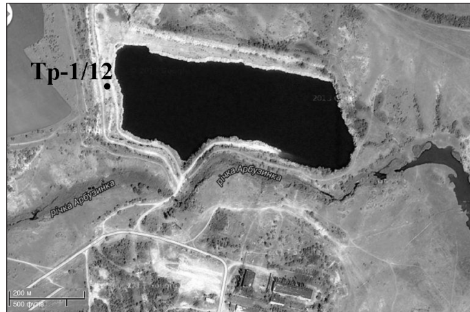
Рис. 1. Супутниковий знімок Трикратського кар'єру

*Відношення ^{87}\text{Sr}/^{86}\text{Sr} , виправлене на радіогенну добавку ^{87}\text{Sr}_{\text{rad}} , як і \epsilon_{\text{Sr}} , розраховане на вік 2030 млн років.