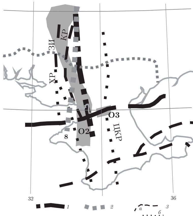
Рис. 3. Сопоставление объектов пониженного сопротивления (O2 и O3) с разломными зонами: 1 — активные в плиоцен-четвертичное время [10]; 2 — линейamentные зоны, активные в новейшее время (8 — Новгород-Северско-Новокаховская) [11]; 3 — по [9]: Западно-Ингулецкая (ЗИ), Херсонская (ХР), Криворожско-Кременчугская (КР), Центрально-Крымская (ЦКР), выделенные уверенно (а) и предположительно (б)